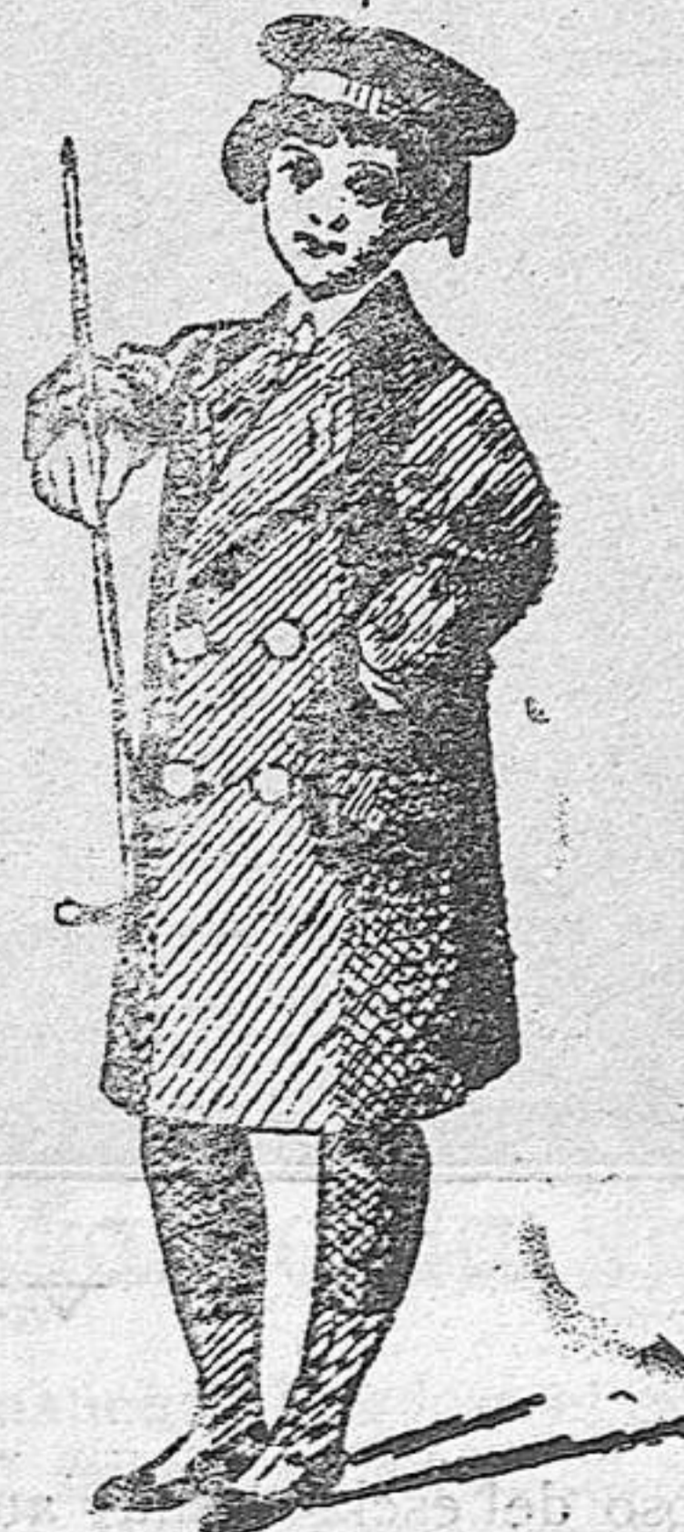
Gabancitos para niños de 10, 12, 18 y 30 pesetas