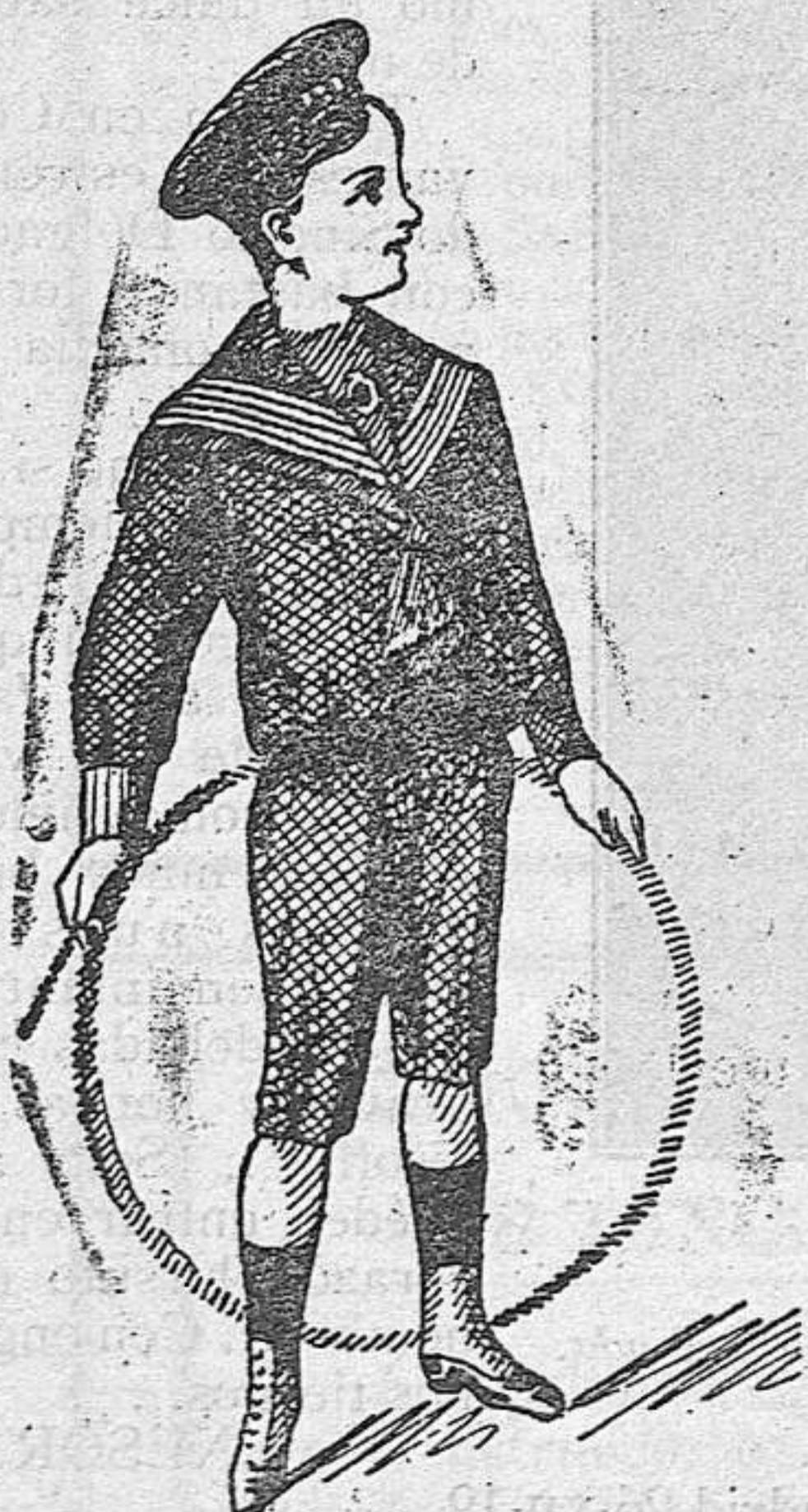
Modelos diferentes en trajecitos de paño

El mejor regalo para niños en Reyes, son las capitas impermeables.