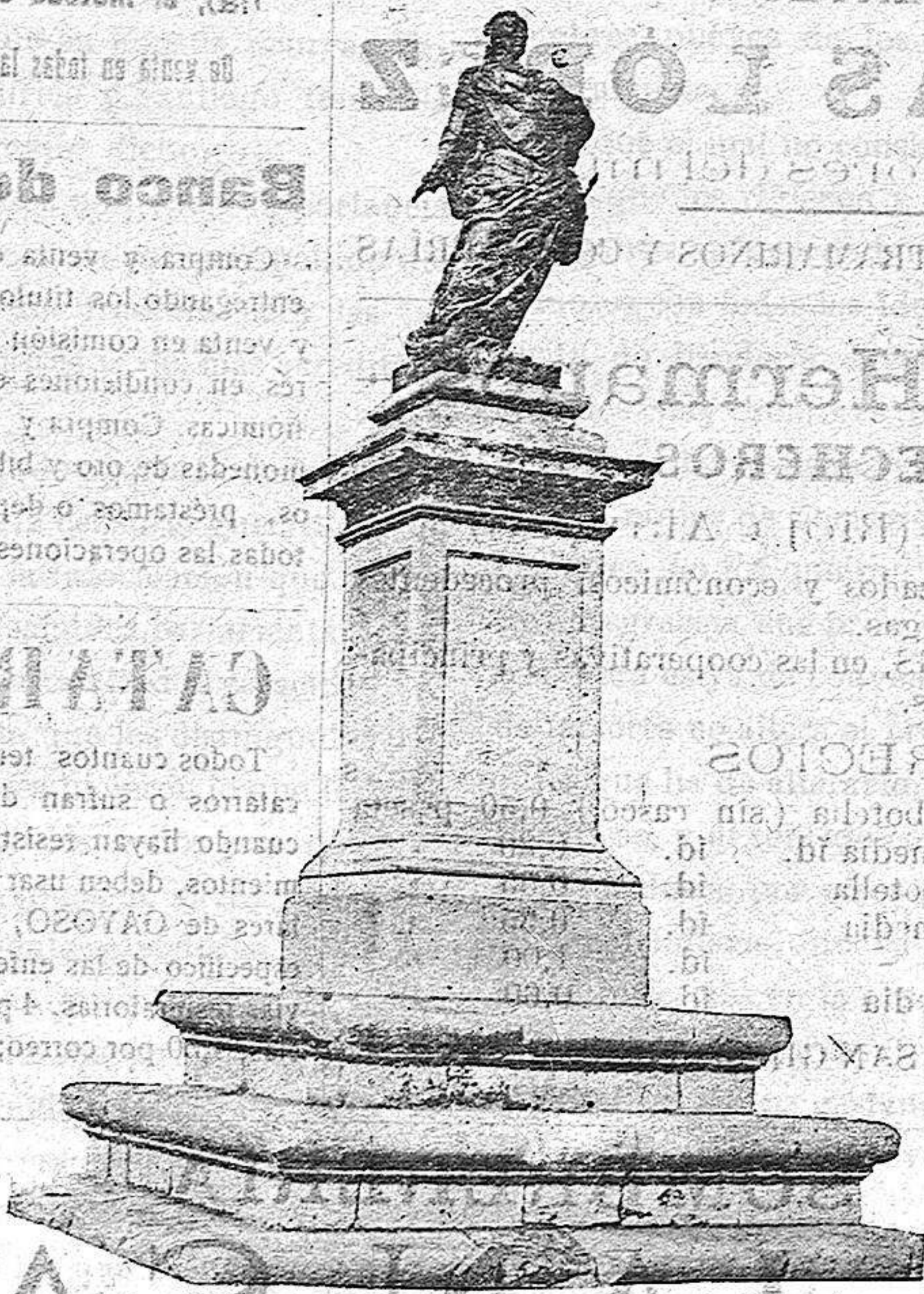
ESTATUA DE CARLOS III