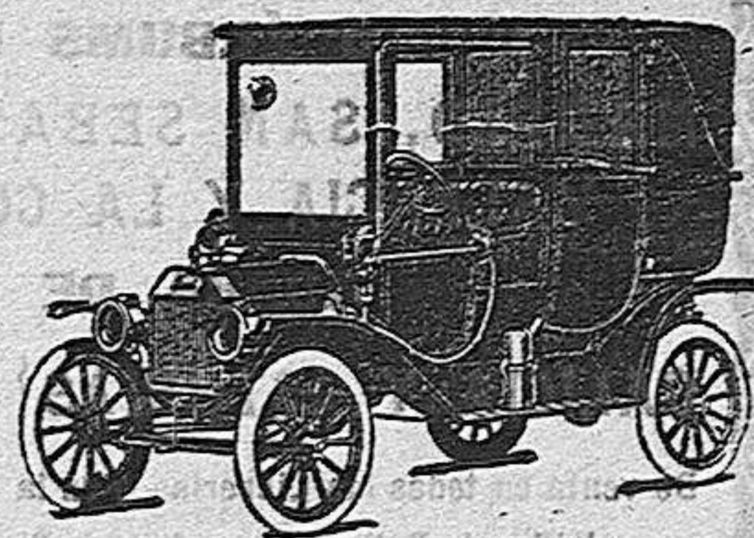
Landaulet 6 asientos