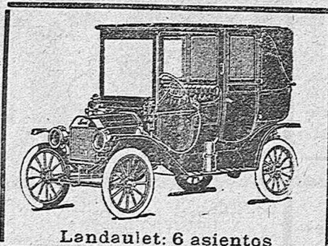
Landulet: 6 asientos