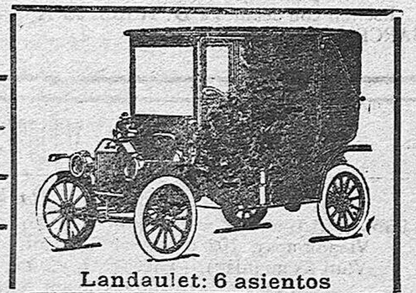
Landulet: 6 asientos