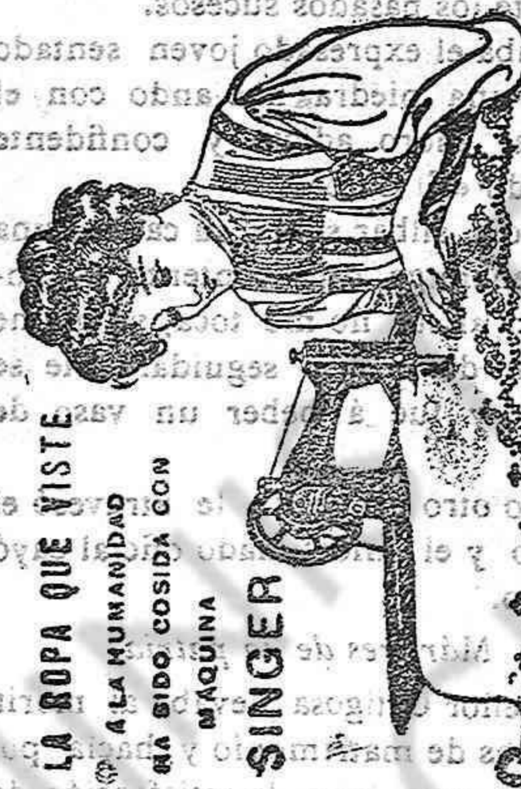
LA ROPA QUE VISTE A LA HUMANIDAD HA SIDO COSIDA CON MÁQUINA SINGER