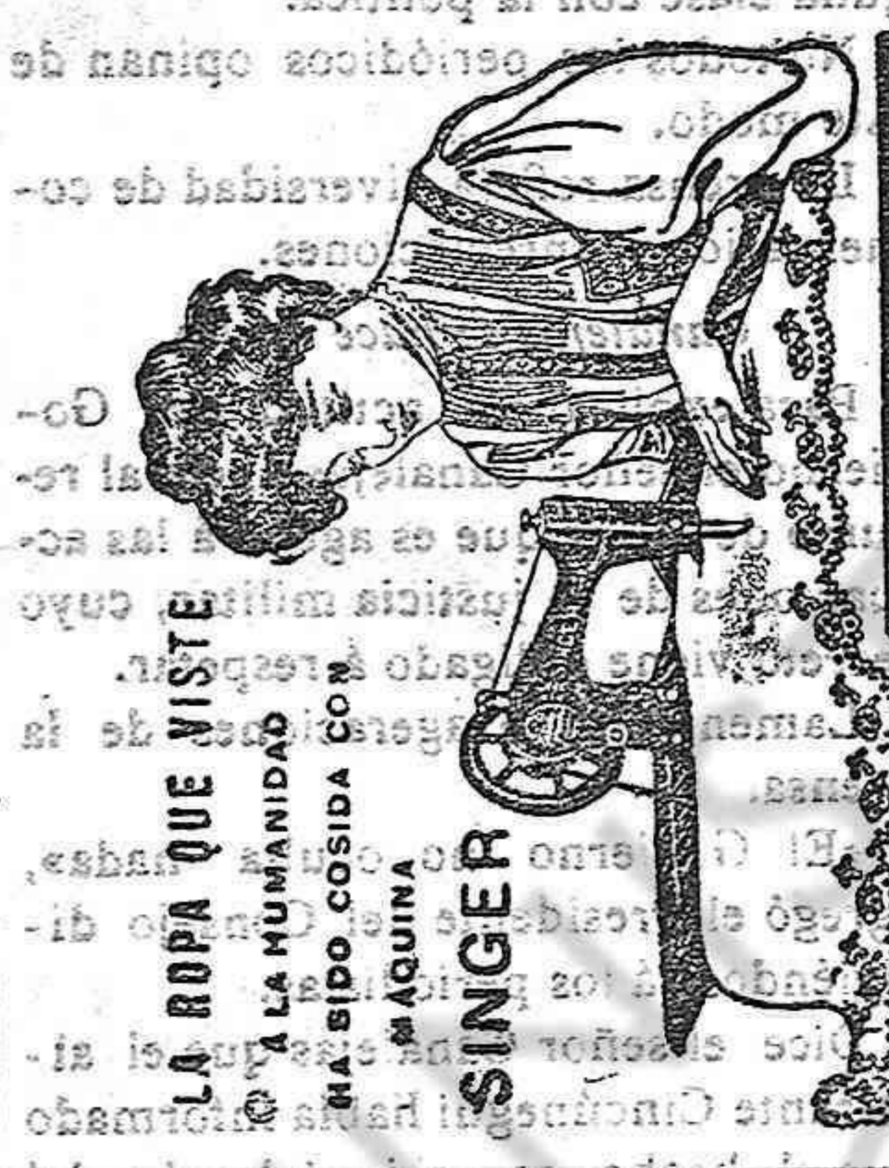
LA ROPA QUE VISTE A LA HUMILDAD MA SIDA COSIDA CON MÁQUINA SINGER

COCINEROS ESPAÑOLES RECIENTEMENTE CONTRATADOS Para pasajes de 1.ª, 2.ª y 3.ª clase y carga, dirigirse a las oficinas de la Compañía: Esseve y Huguet, Plaza Príncipe, 13. — MAHÓN. — Estanco Timoner. — ALAYOR. — Sub-Agencia. — Sebastián Segut, Arguimbau 14 y 16. — CIUDA DELA. — Sub-Agencia.