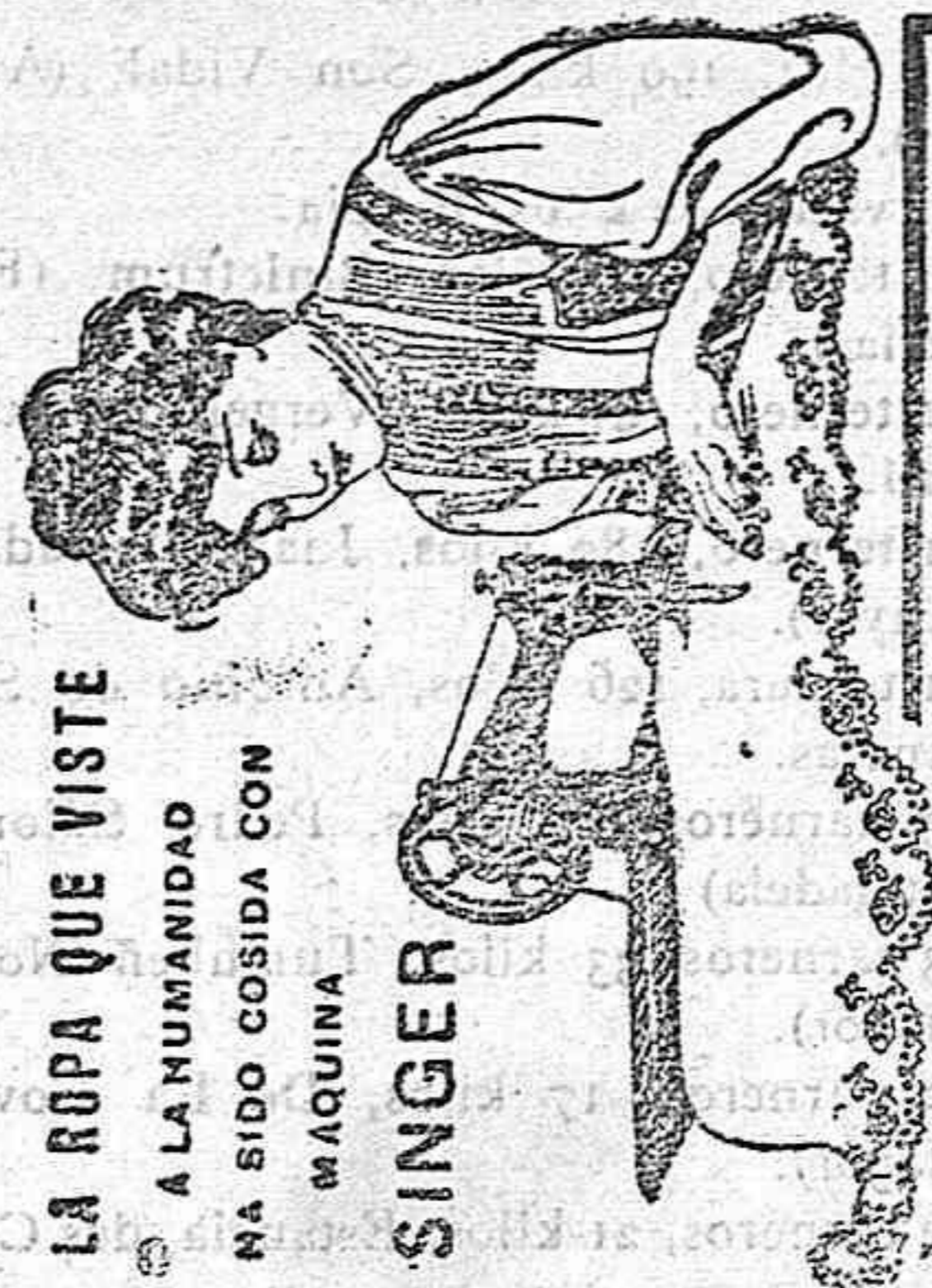
LA ROPA QUE VISTE A LA HUMANIDAD HA SIDO COSIDA CON MAQUINA SINGER