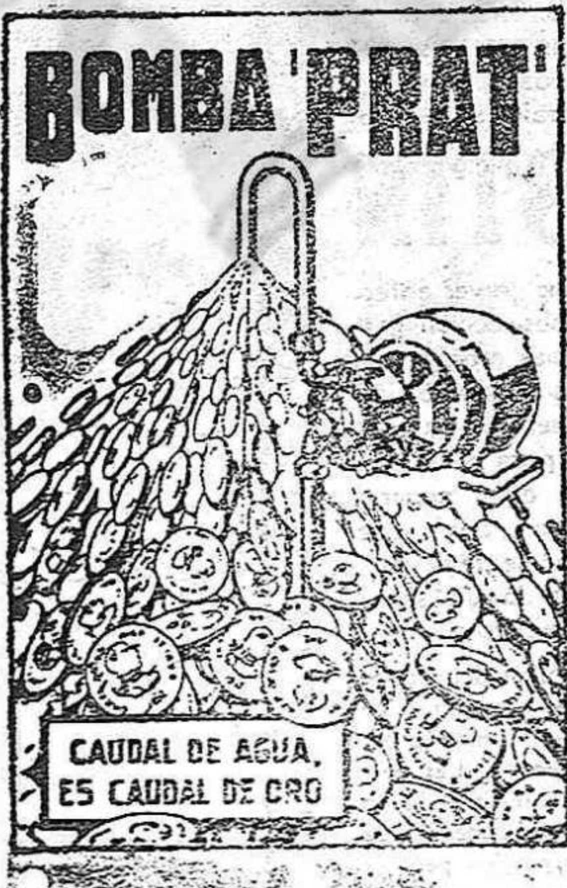
CAUDAL DE AGUA ES CAUDAL DE CRO

AGUA A COMODIDAD, SIN GASTES NI INTERRUPCIONES, Y CON UN CONSUMO DE FLUIDO INSIGNIFICANTE