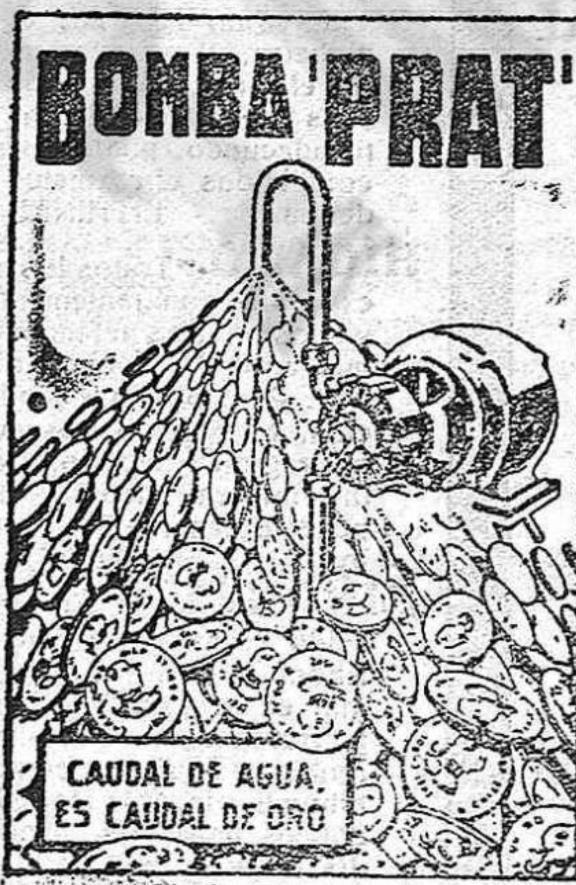
CAUDAL DE AGUA ES CAUDAL DE ORO

AGUA A COMODIDAD, SIN GASTES NI INTERRUPCIONES, Y CON UN CONSUMO DE FLUIDO INSIGNIFICANTE