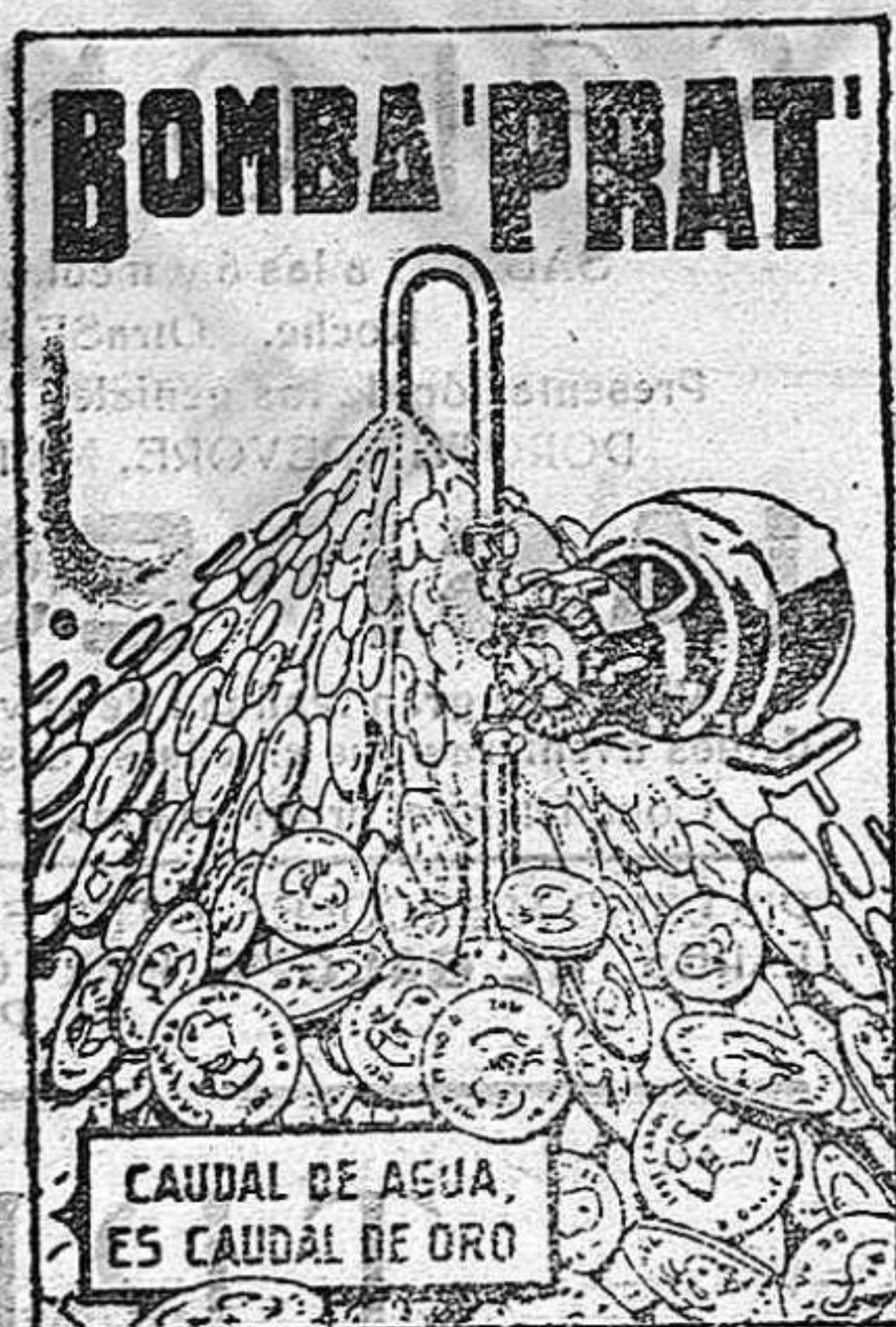
CAUDAL DE AGUA, ES CAUDAL DE ORO

AGUA A COMODIDAD, SIN DESGASTES NI INTERRUPCIONES, Y CON UN CONSUMO DE FLUIDO INSIGNIFICANTE