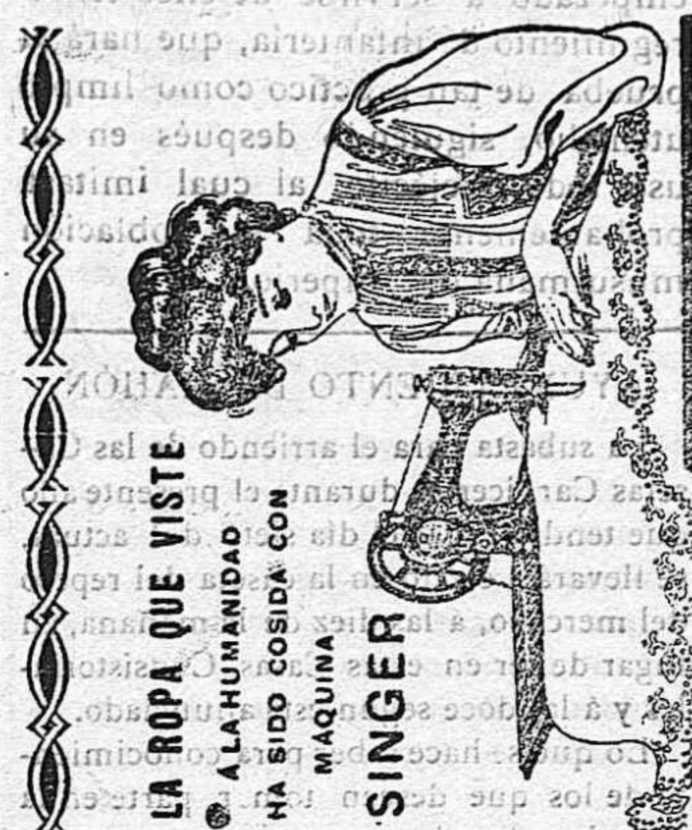
LA ROPA QUE VISTE A LA HUMANIDAD HA SIDO COSIDA CON MAQUINA SINGER