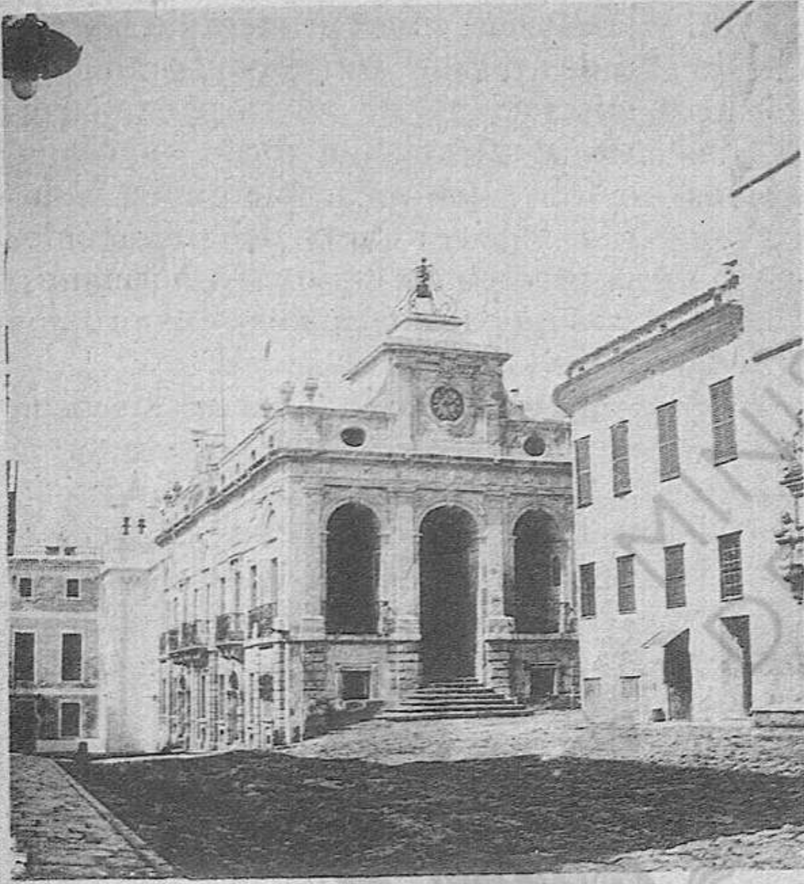
MAHÓN. — Casa Consistorial.

Sin ser un edificio de primera clase en el órden arquitectónico, la Casa del Ayuntamiento de Mahón llama la atención del viajero por su bonita construcción y estilo sencillo pero de gran efecto.