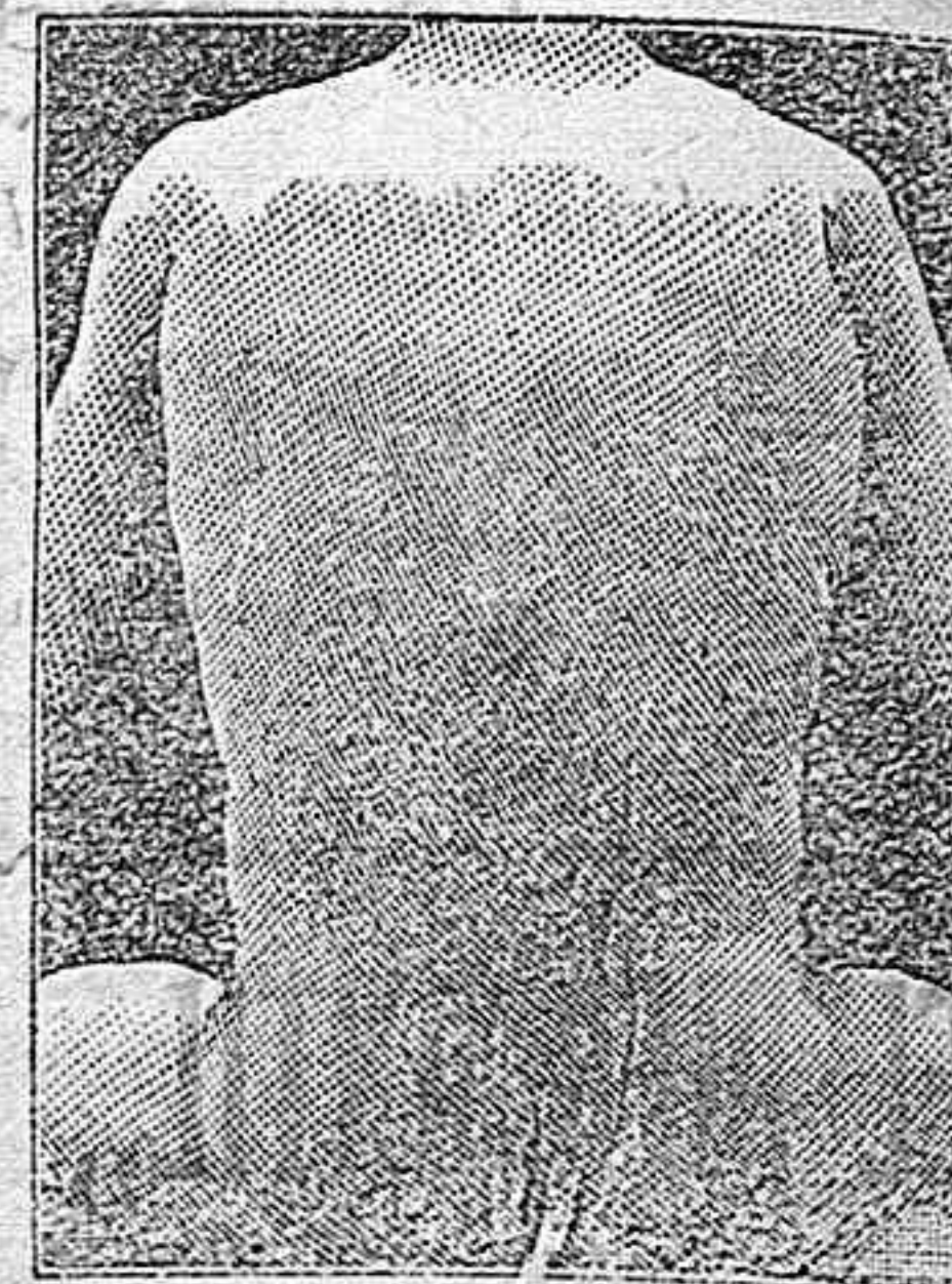
Después de 15 días de curación