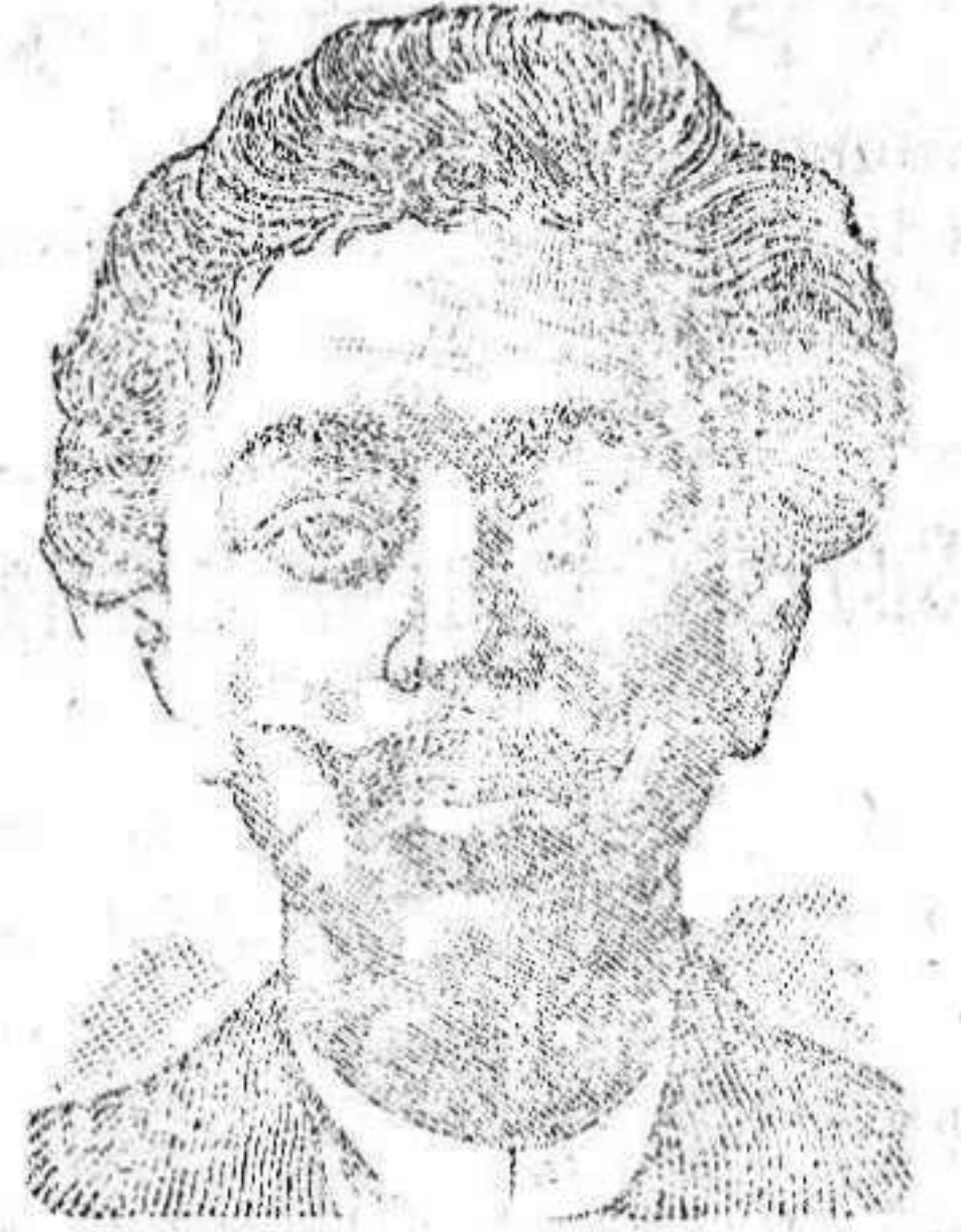
Después de 15 días de la curación