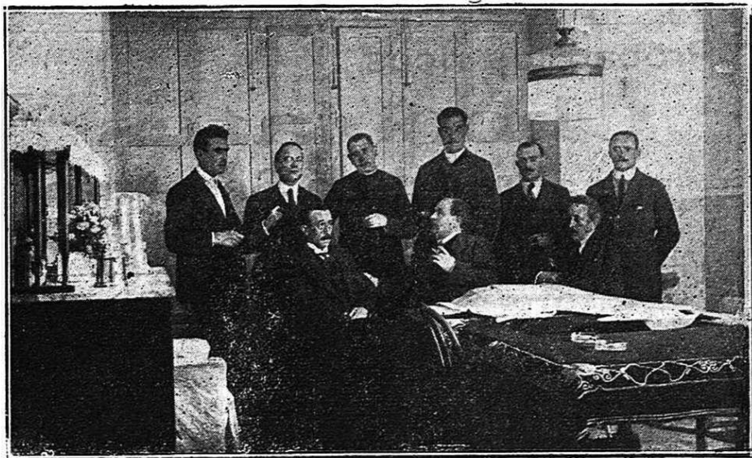
EN EL COVEDOR DE LA CASA GERENCIA