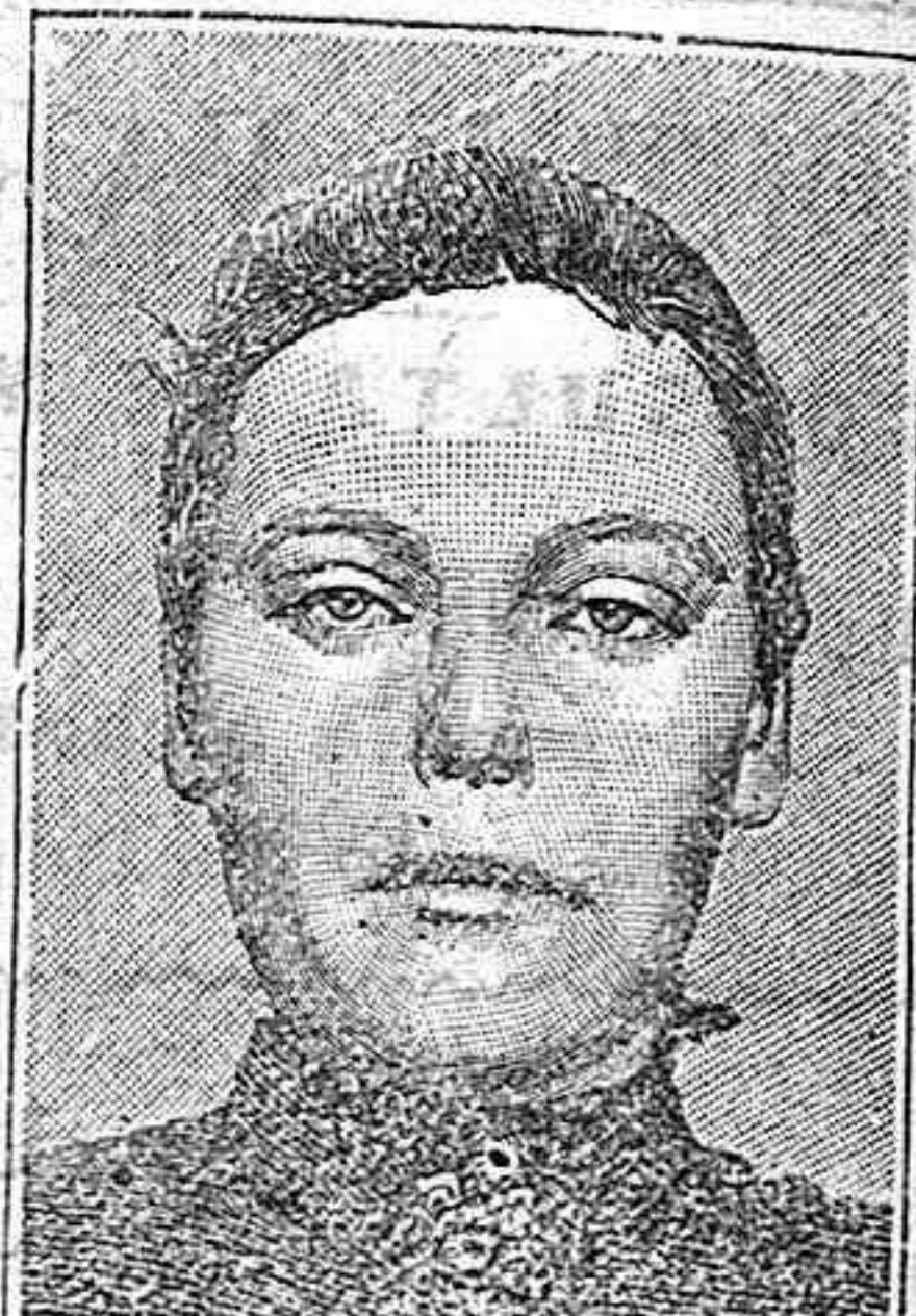
Después de 10 días de curación