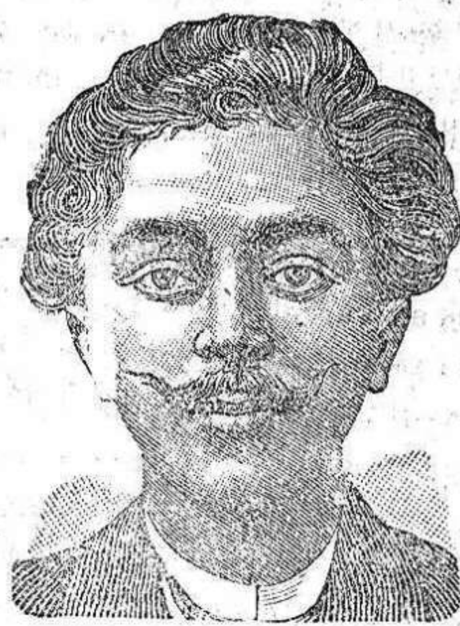
Después de 15 días de la curación