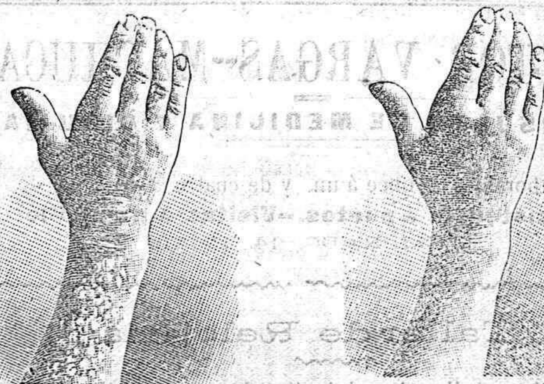
Antes de la curación Después de 10 días de curación

Curación radical de todas las enfermedades de la piel y lasplenas y del artrismo, reumatismo, gota, dolores etc. por medio del TRATAMIENTO DE L. RICHELET