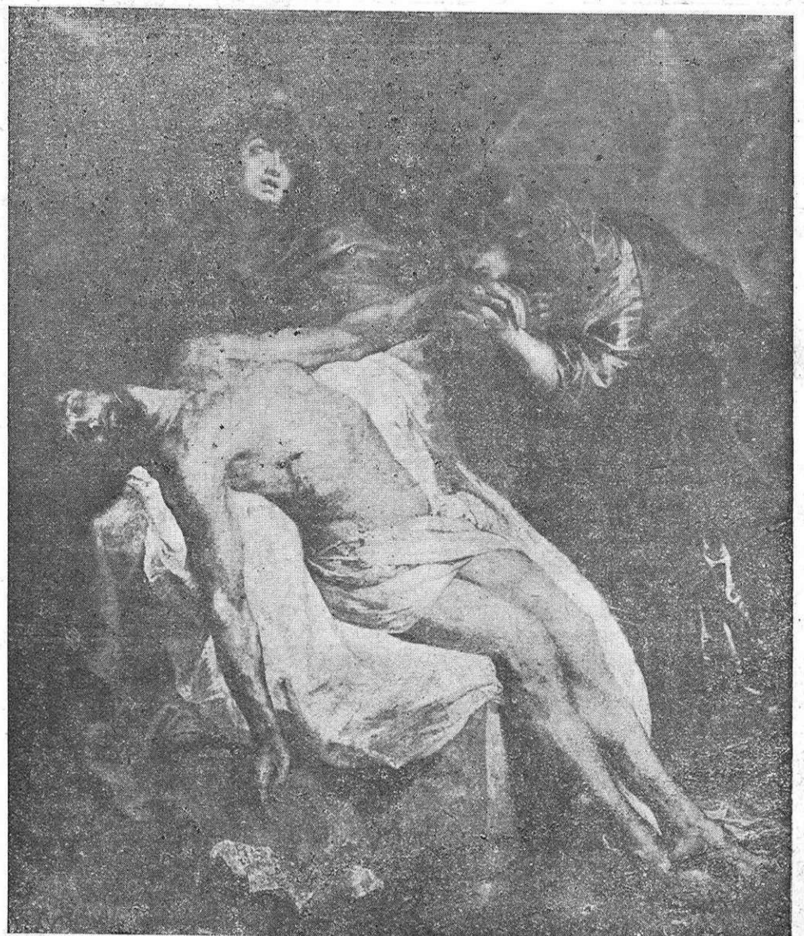
DESCENDIMIENTO (Cuadro de Van Dick)