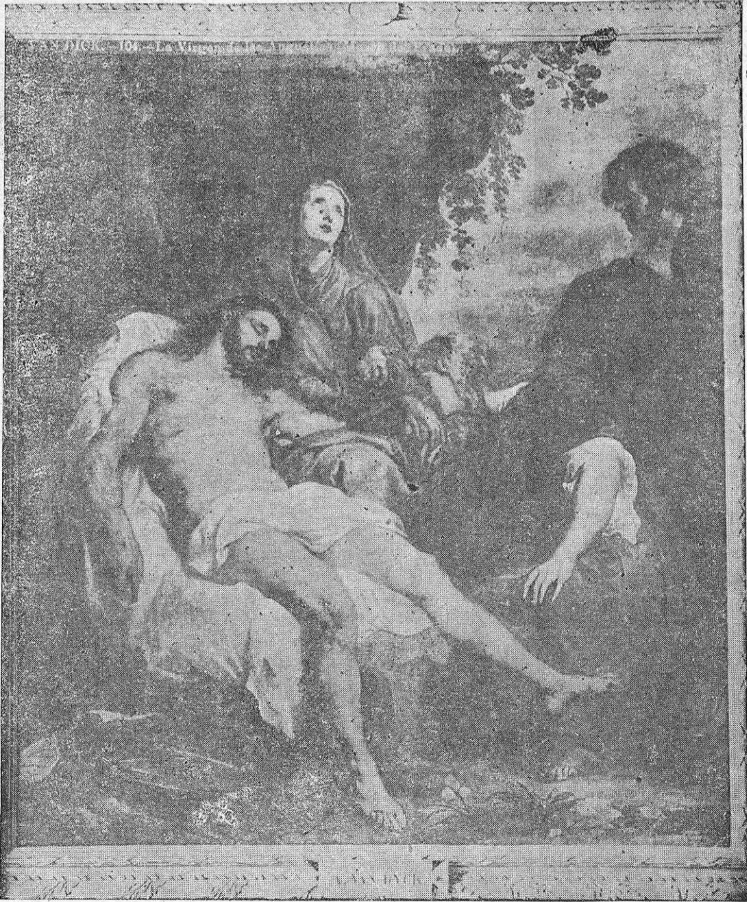
LA PIEDAD (Cuadro de Pedro Pablo Rubens)