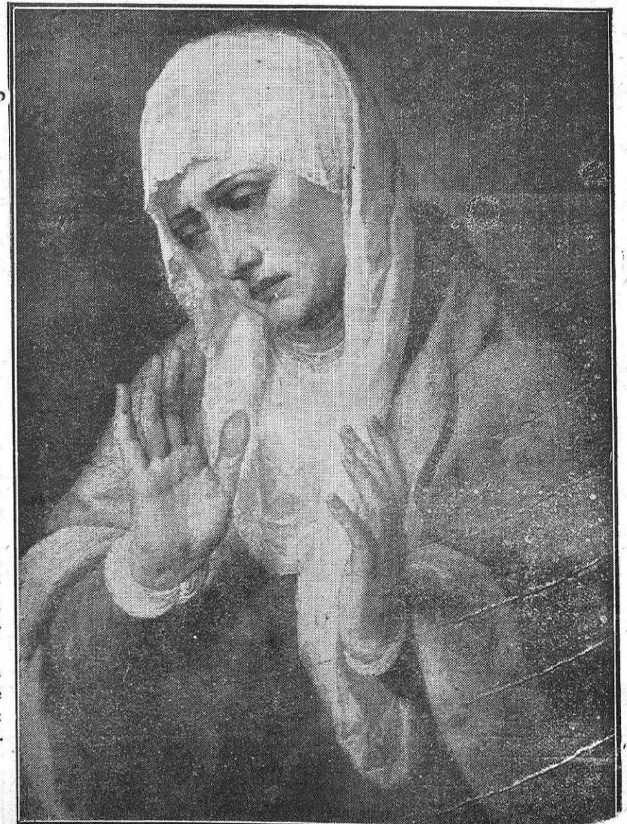
La Virgen de los Dolores (Cuadro de Tintoretto)