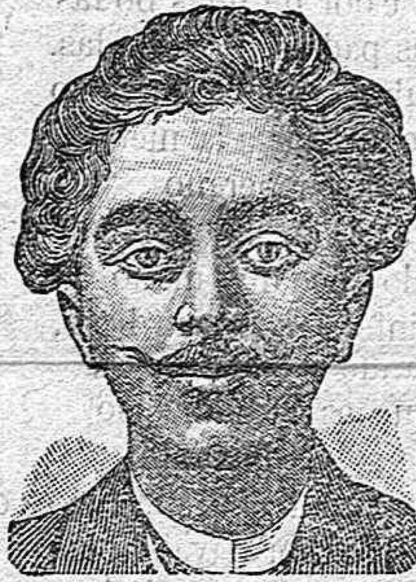
Después de 10 días de curación