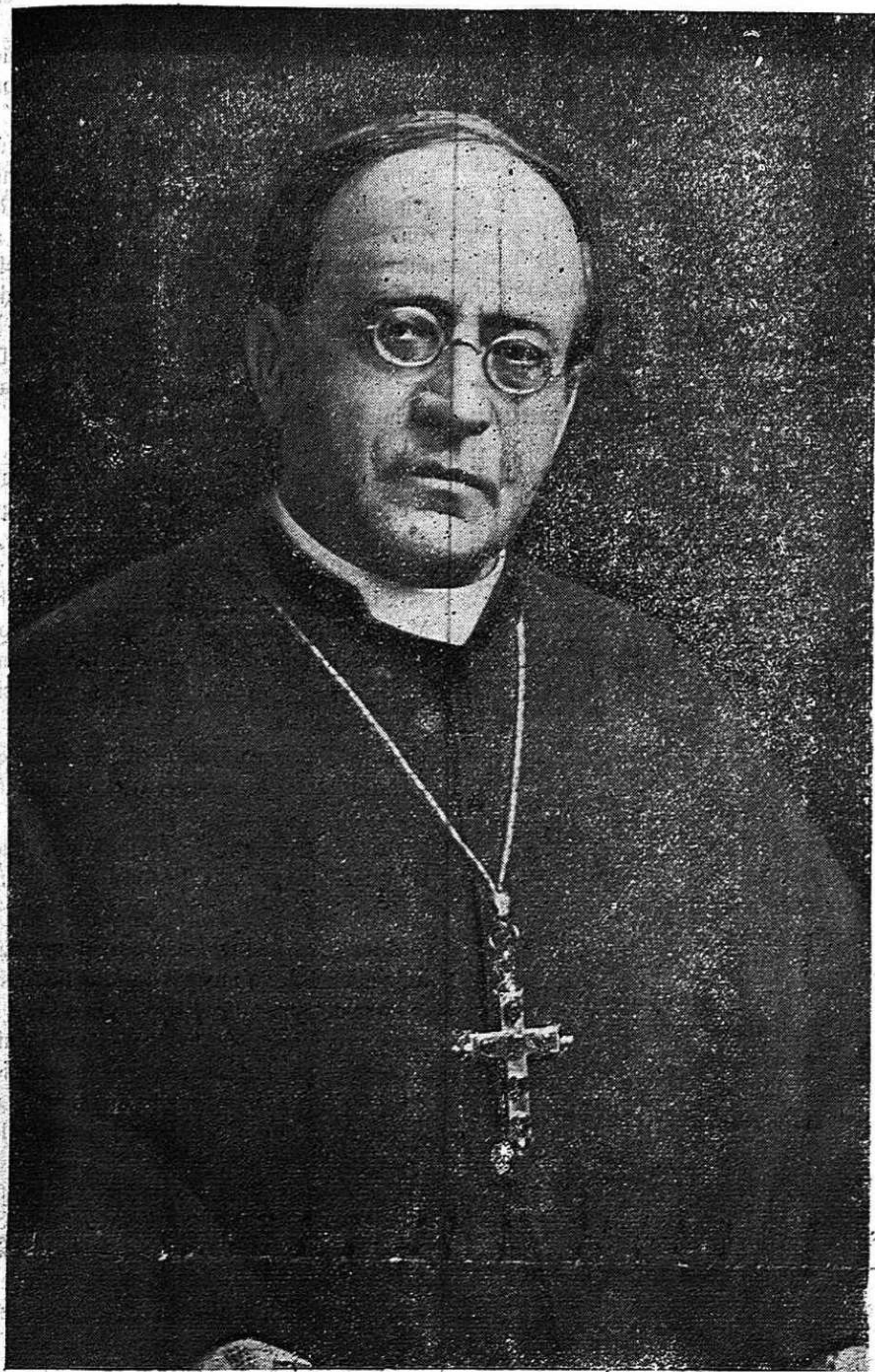
S. S. Pío XI, elegido para regir los destinos de la Iglesia, el día 6 del actual

El nuevo Pontífice, cuyo nombre es Aquiles Ratti, desempeñaba hasta ahora el Arzobispado de Milán.