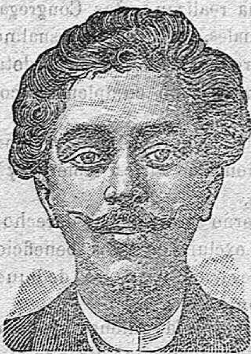
Después de 10 días de curación