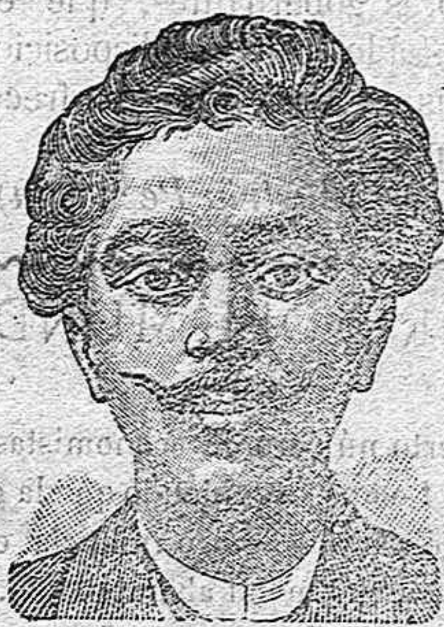
Después de 10 días de curación