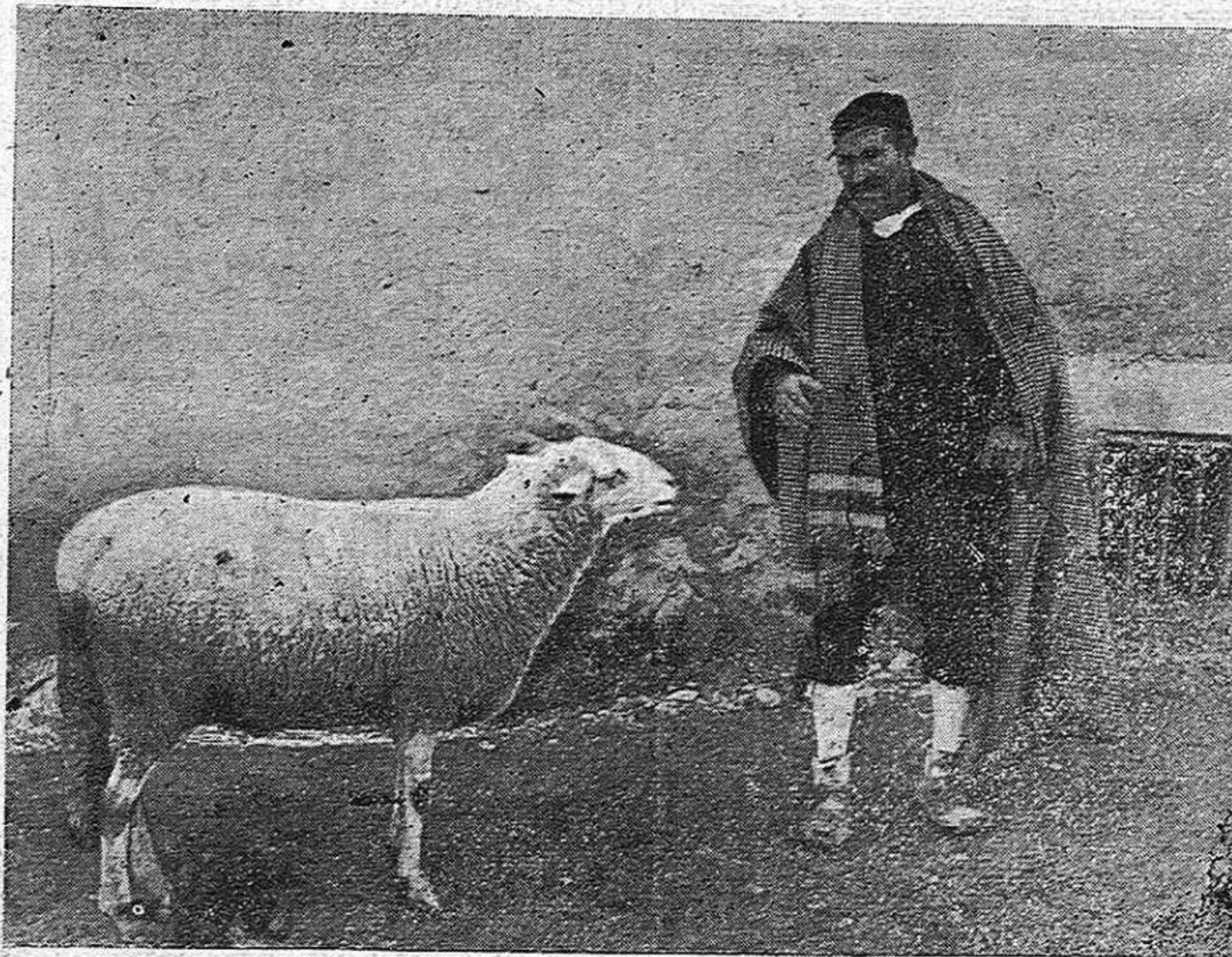
Este fotogrado representa un hermoso ejemplar de uno de los lotes de ganado lanar premiado en el Concurso de Ganadería de Caminreal.

Continuando con esta sección iniciada en el número de 24 de Noviembre vean nuestros lectores ese simpático labriego al que se le aproxima una res del grupo, buscando el pedacito de pan con que otras veces le habrá obsequiado.