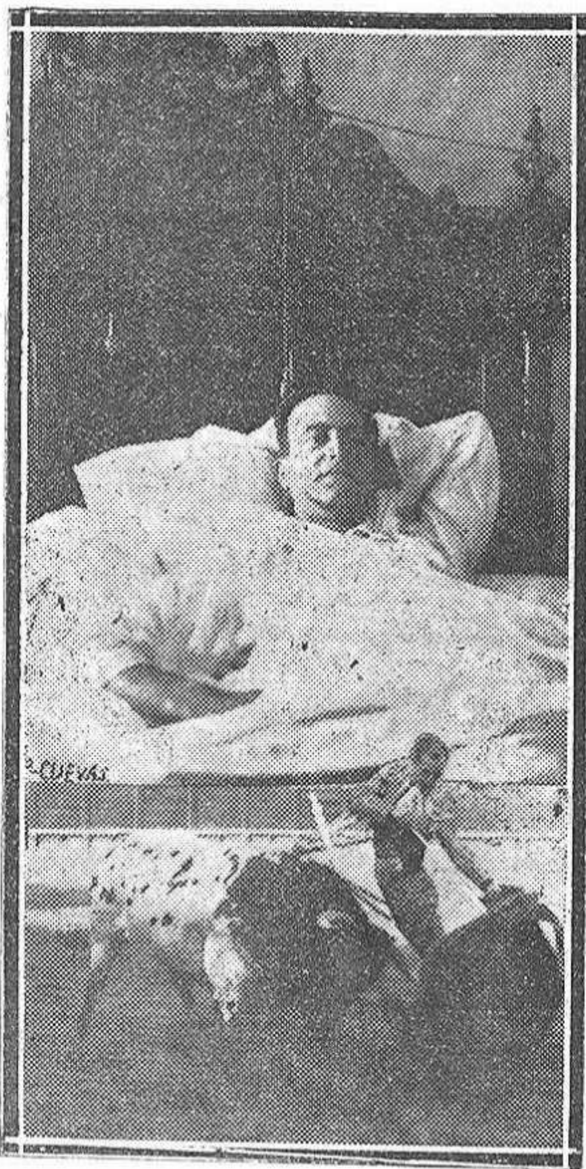
Villalta postrado en el lecho, recuerda sus triunfos en las plazas de Madrid y Sevilla, donde alborotó recientemente a la afición con sus pases naturales...

Agradeciendo mucho las atenciones recibidas, abandonamos las Casas Consistoriales.