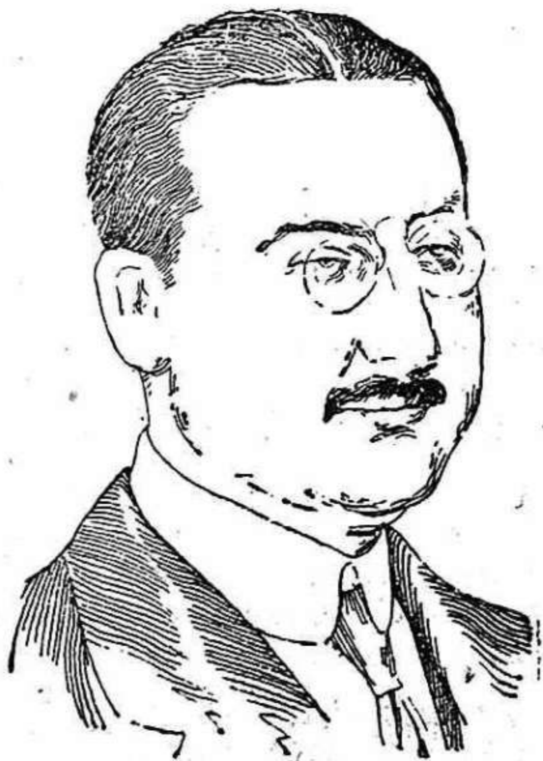
D. Manuel González Hontoria Ministro de Estado