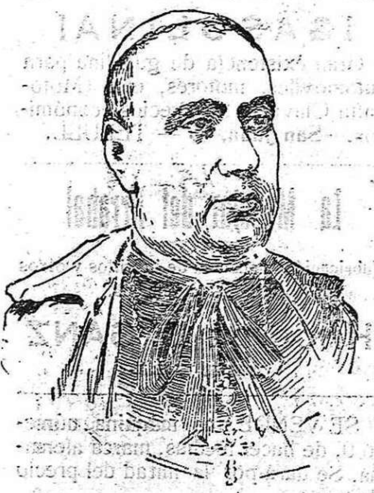
El Cardenal Almaraz y Santos, primado de España, que con gran pompa ha hecho su entrada oficial en Toledo.