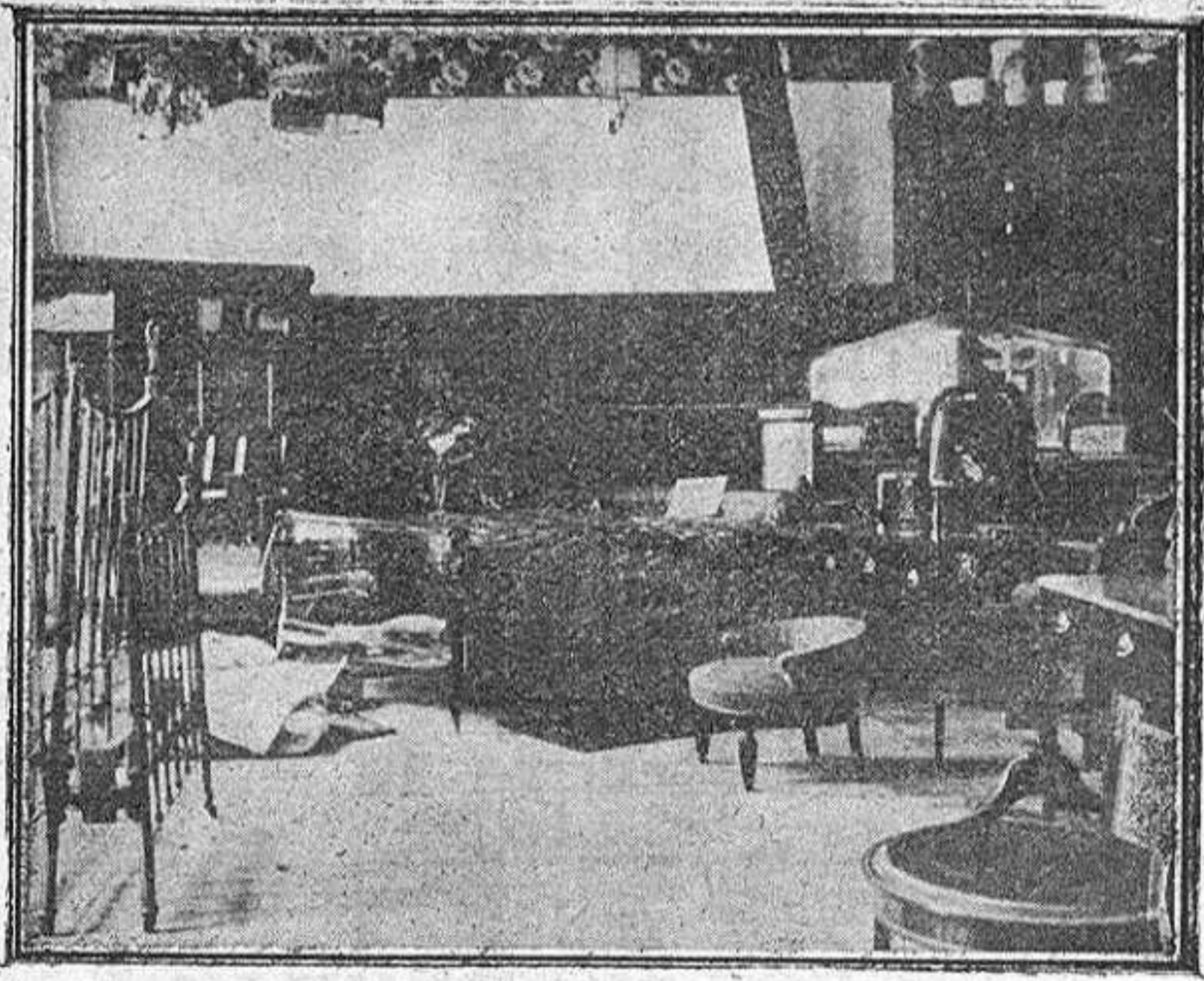
Un detalle de este Establecimiento