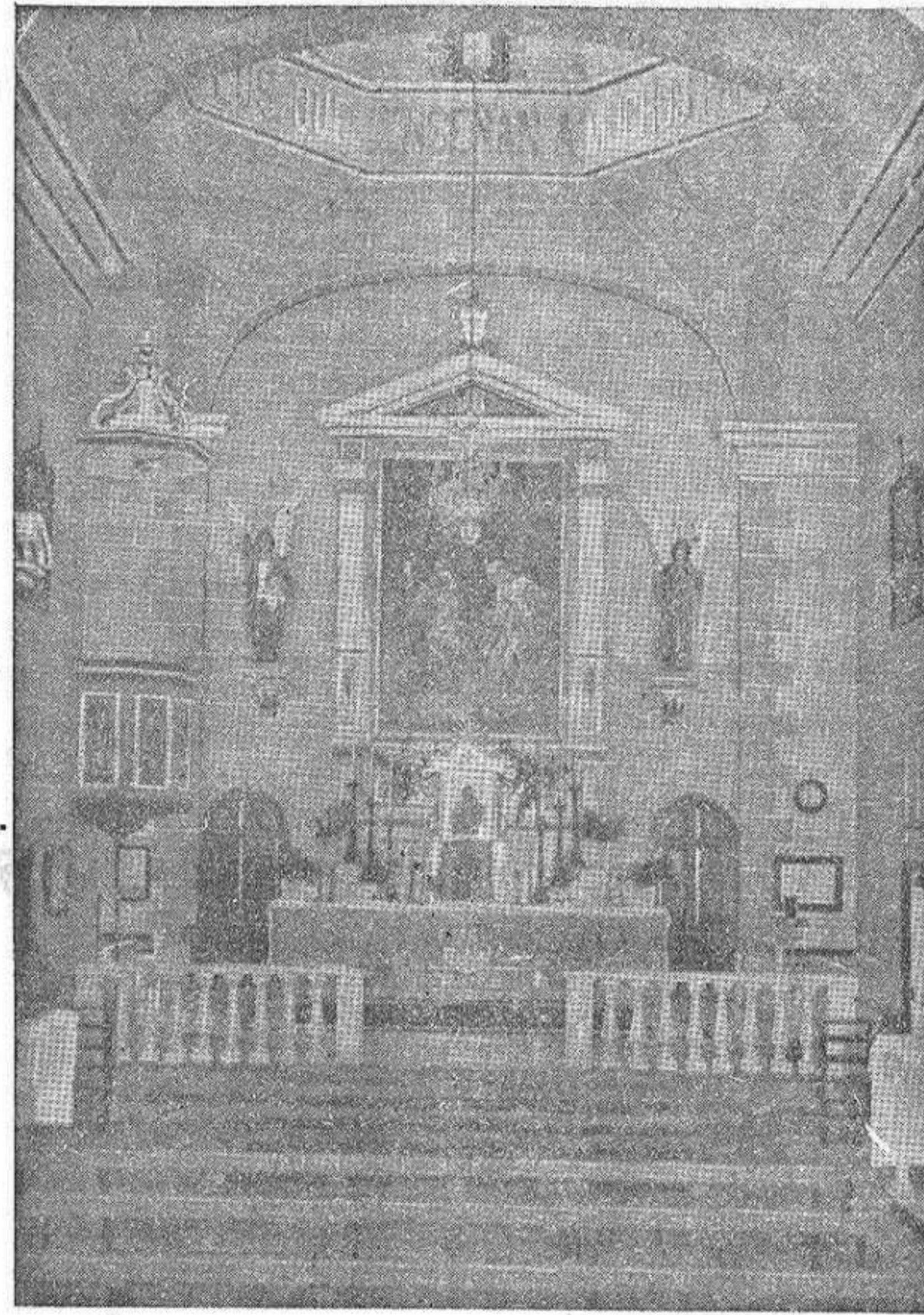
Magnífica capilla de las Escuelas del Ave-María de Benimámet.