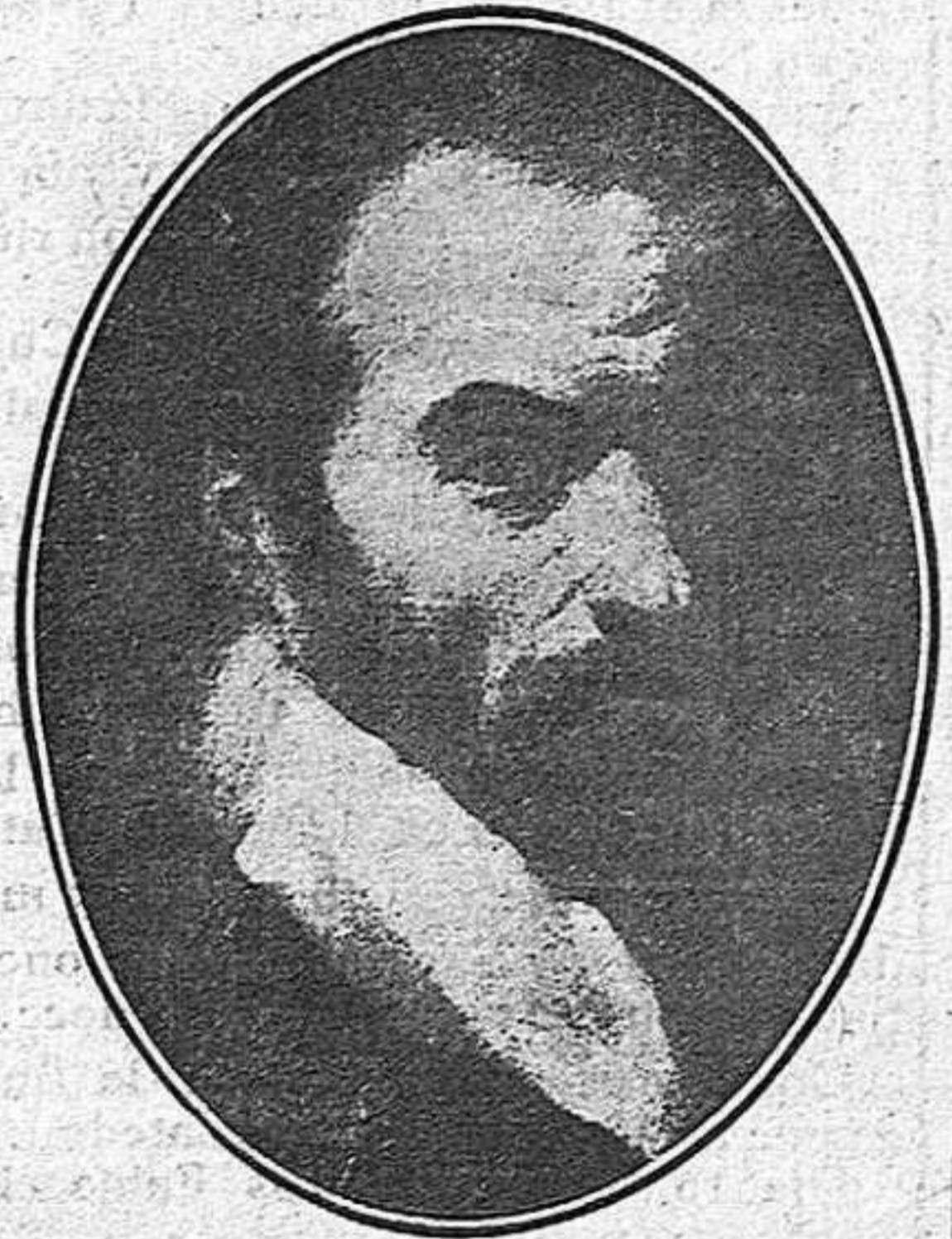
Autorretrato de Francisco Ribalta

Hoy, día 13, se cumplen trescientos años de la muerte del glorioso pintor Francisco Ribalta, artista insigne cuyo sólo nombre estremece de admiración y ocupa los primeros puestos de la «Escuela Pictórica Valenciana», que tuvo el honor de servirle de cuna y taller famosísimo de sus producciones que con tanta estima se custodian en los más notables Museos y en las más insignes Catedrales e Iglesias.