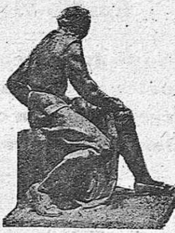
Monumento a Francisco Ribalta, erigido en Castellón.—Detalle de la estatua.

lienzos existentes en el Museo del Prado y varios más, adquiridos por pinacotecas extranjeras. Las principales obras de Francisco Ribalta existentes en España son: Museo de Valencia.—Jesús y San Juan, niños; San Francisco de Asís; San Isidro Labrador; La Virgen y el niño Jesús; San Francisco y Jesucristo; La Virgen de Porta-Coeli; San Juan en el Desierto; San Pedro Apóstol; San Bruno; San Pablo; San Juan Bautista; Calvario; Coronación de la Virgen; Última Cena del Señor. Metropolitana de Valencia.—Jesús con la Cruz; Sacrificio de Isaac; retratos de obispos. Corpus Christi de Valencia.—La Cena. Santa Catalina de Valencia.—Dos lienzos. San Nicolás de Valencia.—Varios lienzos. Convento de Jerusalén de Valencia.—El Sal-