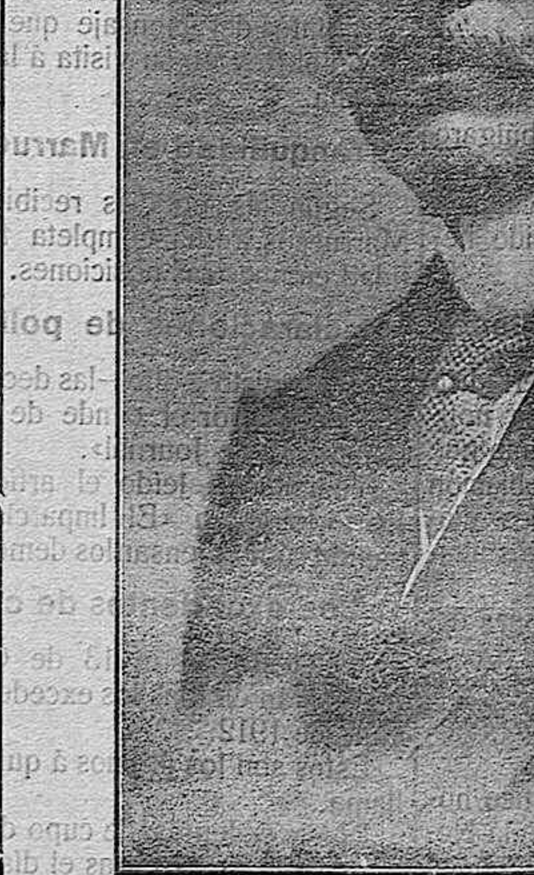
Excmo. Sr. D. Eduardo Dato, Diputado a Cortes por Vitoria

Por virtud de este decreto, emprendió el Gobierno numerosas obras de construcción y reparación de carreteras, gestiones que son bien conocidas del pueblo de Vitoria y que no serán nunca agradecidas como beneficiosas para esta provincia, llevadas con singular