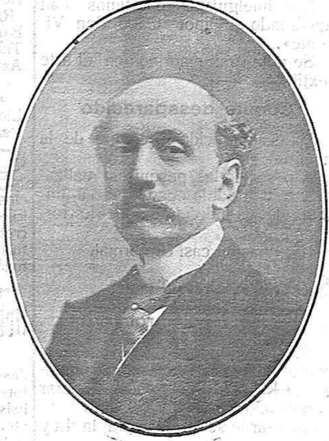
Don Eduardo Dato

Todo esto decíamos en nuestro número del 8 de Junio de 1915, y desde esta fecha, lo mismo que