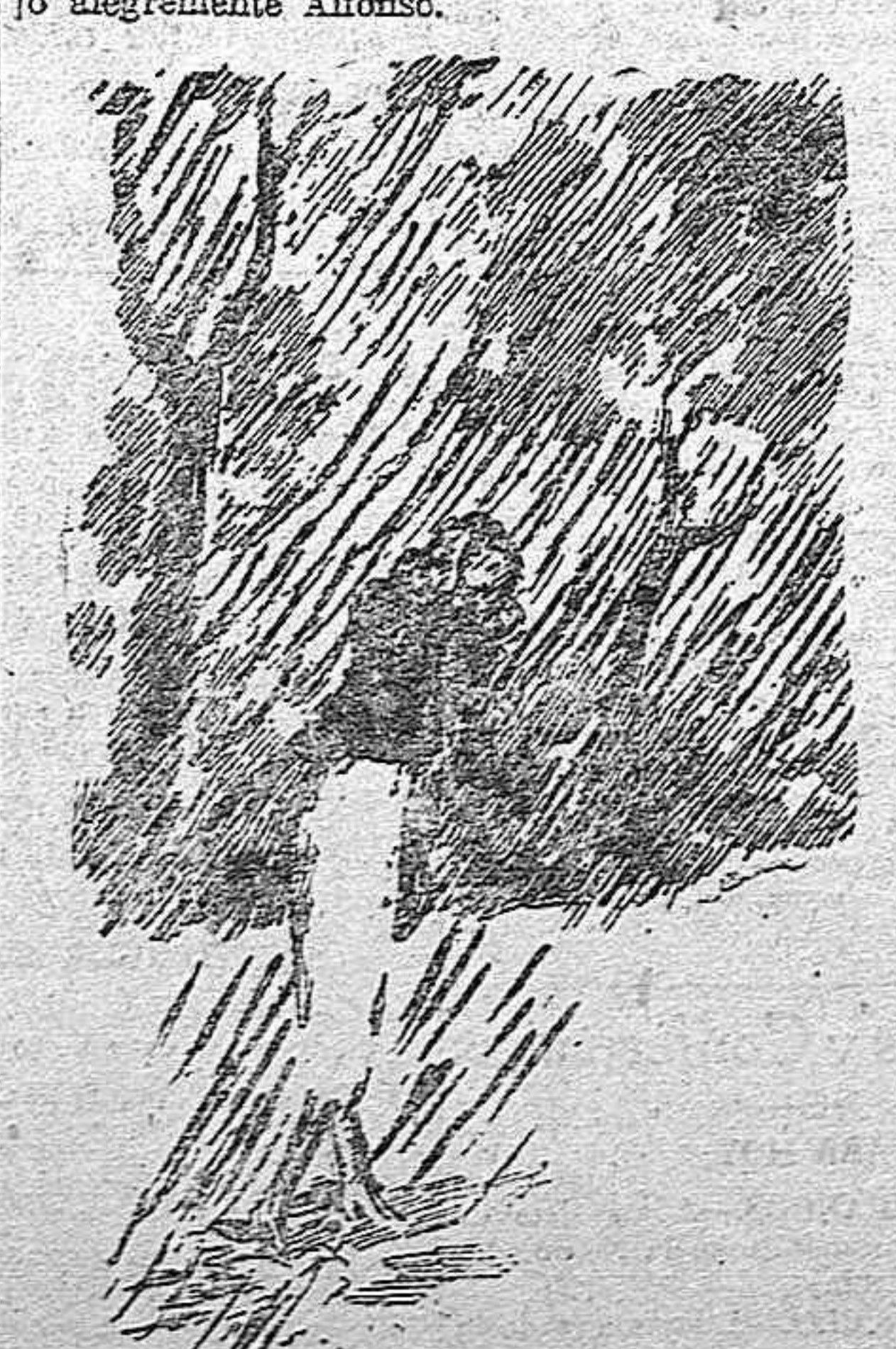
...atravesé el jardín en busca del sitio convenido.