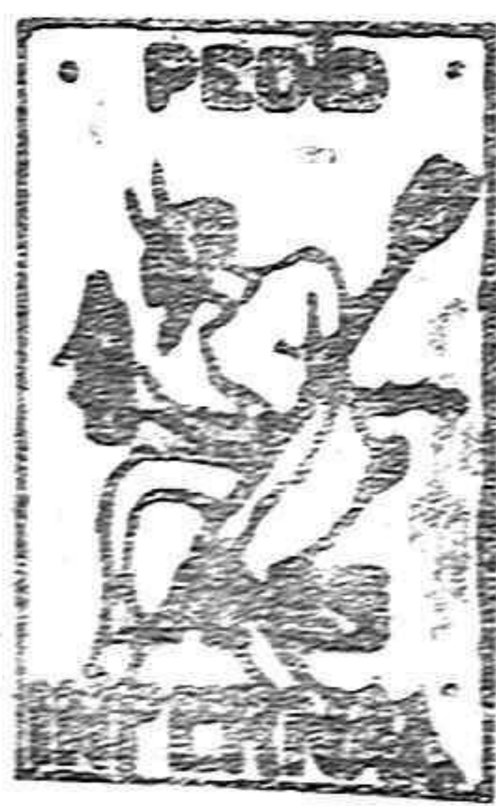
De venta en Gueita y principales Compañías de Utrera y Vizcaya

Salen los trenes de Vitoria (Norte), á las 9'20 y 16'05. Regresan, á las 9'05 y 13'47. Servicio especial los días de mercado en Vitoria. Se expenden diariamente billetes de ida y vuelta y sencillos, muy económicos, á Bilbao y San Sebastián.