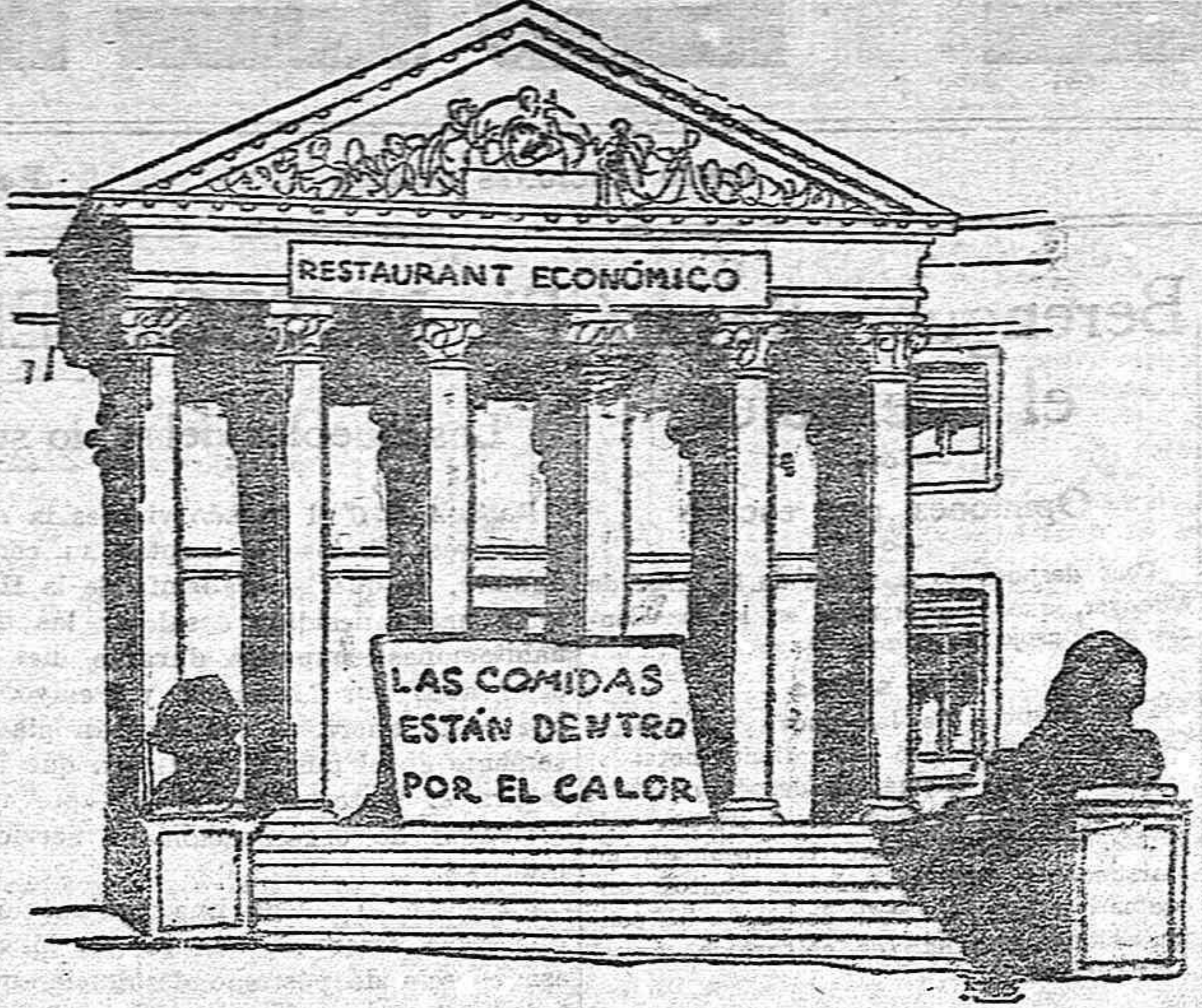
a régimen parlamentario.