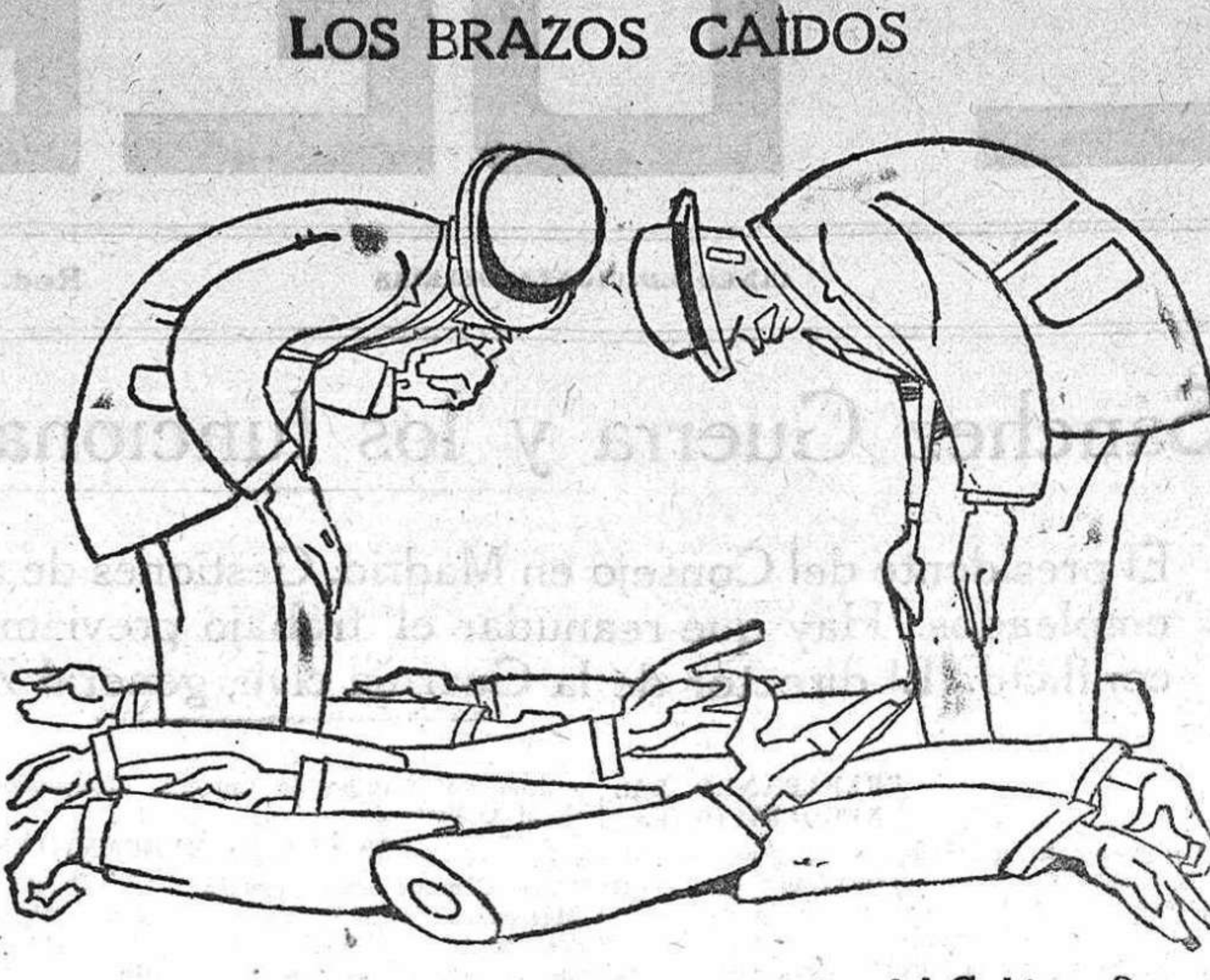
—¿Son los del Cuerpo de Correos o son los del Gobierno?

Inundaciones en Inglaterra LEAFIELD, 9.—Continúan las lluvias torrenciales, que han causado grandes inundaciones en varios puntos. En Neilton y Nowbray la lluvia alcanzó 4,83 pulgadas durante veinticuatro horas. En Doncastle, 4,08 pulgadas, y en muchos otros los aguaceros han sido violentísimos. Los temores de carencia de agua, que preocupaban al ministro de Sanidad, han desaparecido, y las fuertes sequías del año pasado no se repetirán. CONTRA LA FALTA DE TRABAJO LEAFIELD, 9.—El problema de la falta de trabajo y las medidas para remediar la desastrosa situación que lleva consigo, sobre todo en el próximo invierno, es objeto de estudio por dos Comités del Gabinete. El primer ministro es el presidente de uno de dichos Comités, que está examinando en gran escala los aspectos del problema y las medidas de remedio que deben aplicarse son estudiadas por el otro Comité, presidido por sir Alfred Mond.