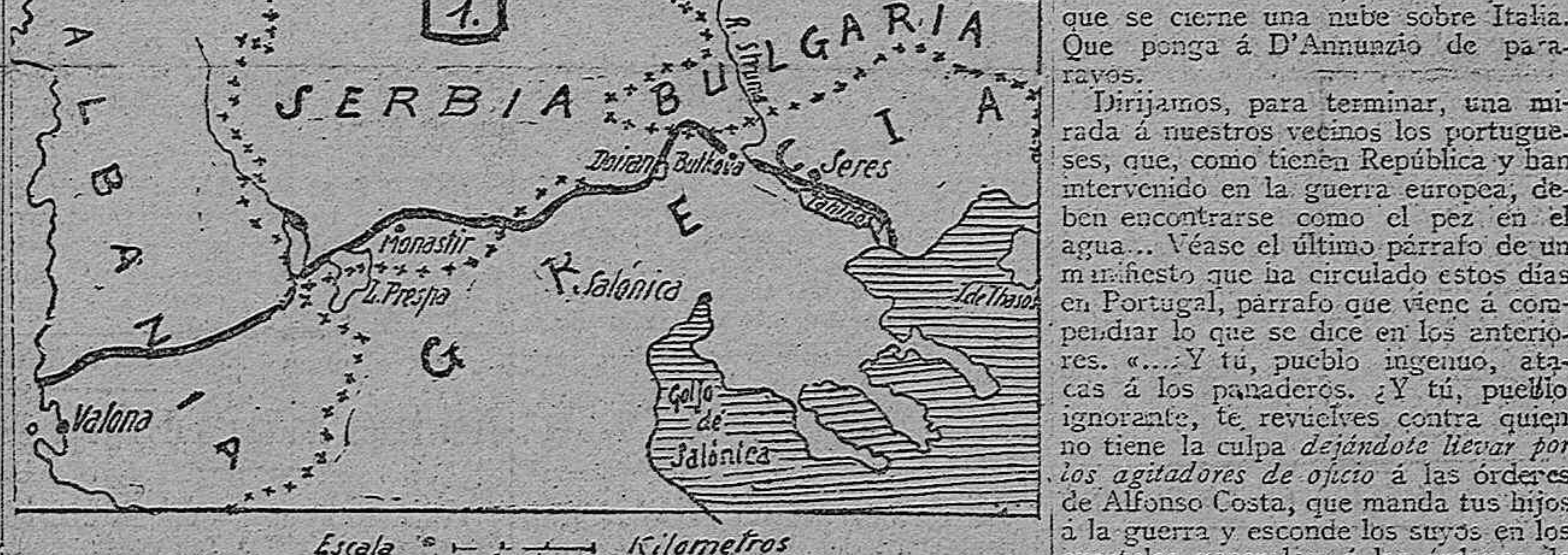
Escala 0 a 20 40 60 Kilómetros