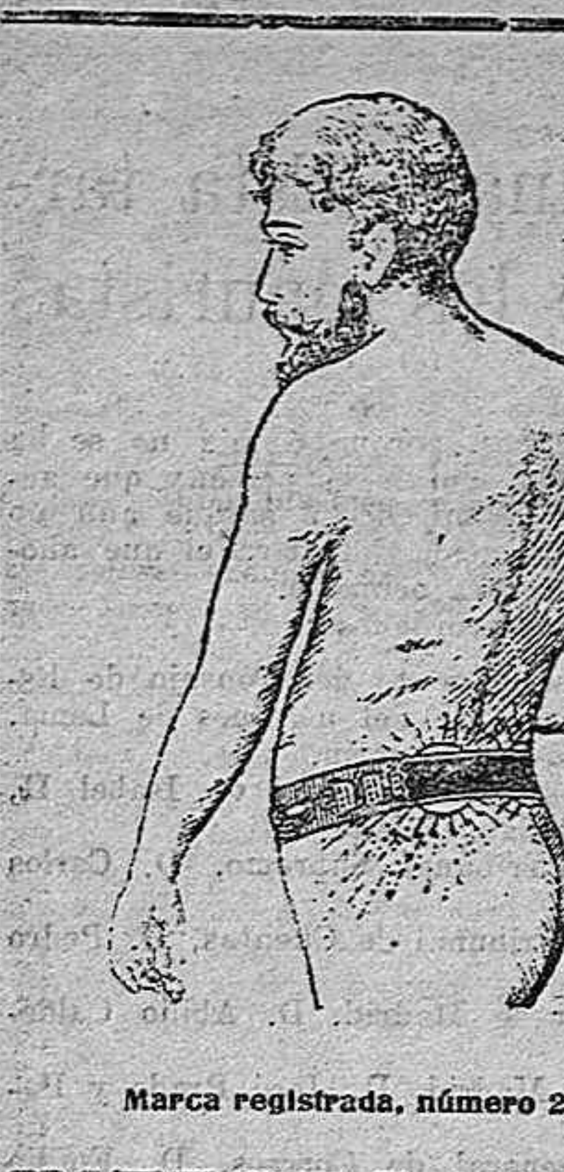
Marca registrada, número 28.457.