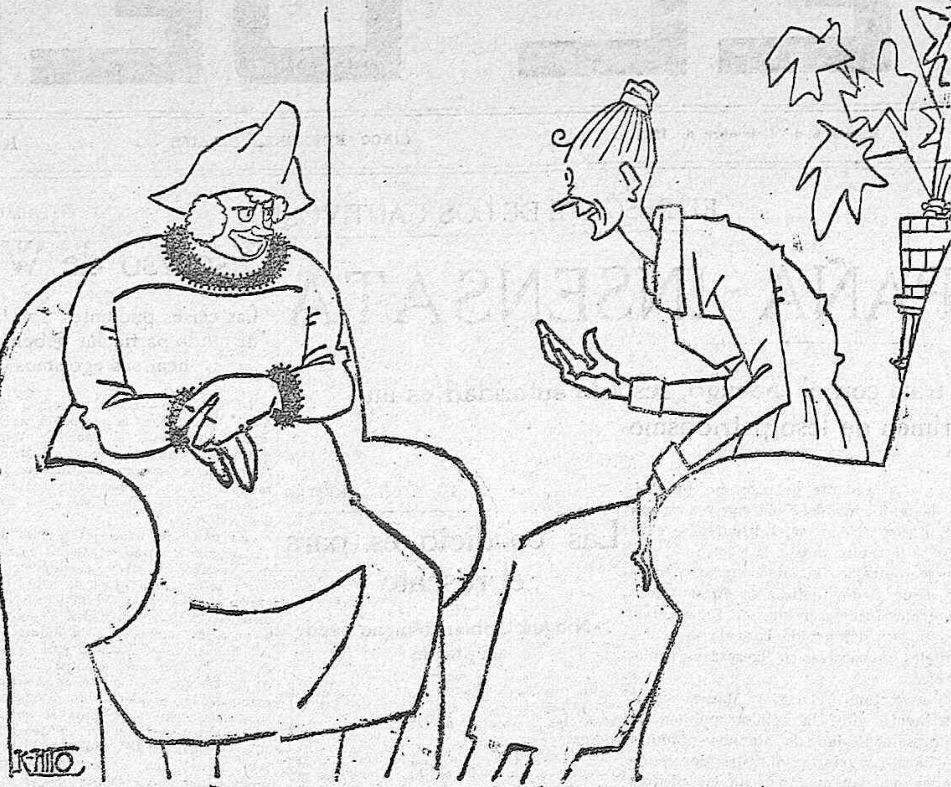
—Si, sí. Mi niña tiene novio; pero a cada momento riñen, hacen las paces, vuelven a reñir... Son muy liberales, muy liberales.