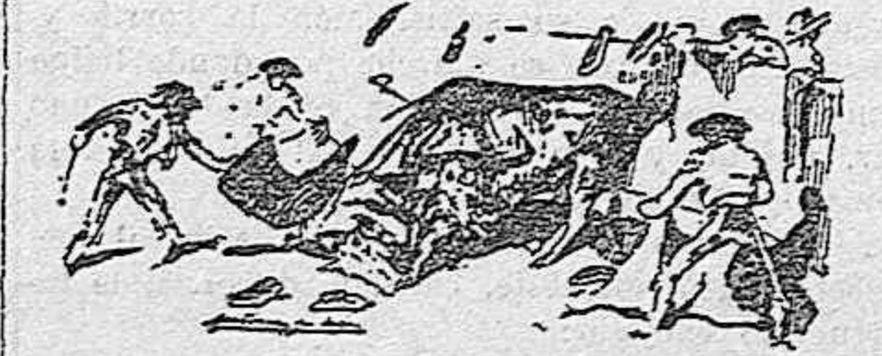
Un furioso chaparrón de naranjas, almohadillas y botellas cayó al redondel.

—¡Qué cañón!—comentó otro anticarmonista. —¡Ni con cañón se atreve ese! —¡Señore, que hay que ver lo flamenquiyo que está er miura! —¡Y que Carmonita está por la ópera italiana y no quiere más con los flamencos! —Pero ¿qué queréis ustedes?—clamaba Copita. Y, entre la cada vez mayor indignación de la multitud, Manuel, convencido de que no había otro modo de derribar al miura, acabó con el toro de un golleteazo traicionero. No quedó rama en el árbol genealógico de Carmona que no fuese violentamente zarandeada en los tendidos, ni parte del cuerpo del lidiador sin su correspondiente maldición. Lo menos diez copiosas ediciones del voluminoso diccionario de denuestos quedaron agotadas en el breve tiempo que empleó Manuel en trasladarse desde el lugar del suceso a los capotes. El torero, sereno siempre, y satisfecho por haberse salvado de todos los riesgos que acababa de correr, lavóse prolijamente las manos en el chorro del botijo que sobre ellas vertió el mozo de espadas, y luego de secarlas con una blanquísima toalla, sentóse en el estribo, diciendo tranquilamente a sus peones, que miraban de soslayo a los conocidos de la barrera, y fiando los carrillos, soplando fuertemente y moviendo la cabeza con un gesto de inteligencia: —¡Cuar gritan esos marfitos! —¡Qué humor tiene usté, Manuel!—le dijo desazonado Carita, el otro espada que iba a entrar en turno. —¡Calla, tonto!—le respondió Carmona.— ¡Si al indignado público era soñar lo imposible, y