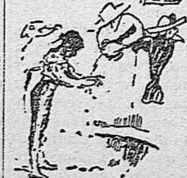
El torero lavóse las manos en el chorro del botijo que sobre ellas vertió el mozo de espadas.

Carmona daría algo por que así fuese. Nadie sabe lo que duran dos toros aguantando la mecha de un broncazo. Únicamente Copita y Currito permanecían ajenos al suceso. Al doblar el toro, Currito había vuelto a Copita y le dijo en voz baja: —Dame usté eso. —¡Ahora, niño?—interrogó sorprendido y alarmado Copita. —Ahora, sí, señor—contestó el otro sencillamente. —¡Pero, chiquiyo, si ahora toca er chorreo!—Pues por eso—replicó Currito muy tranquilo. —Pues vaya, que sea, y que Jesús der Gran Puer t'acompañe. Las cosas en gordo—concluyó Joaquín, entregándose a un cauteloso y precipitado cambio de objetos, que llevaba escondidos, con el chaval, aunque sin tenerlas todas consigo, porque desde que apareció con sus compañeros en Tabladilla el toro chorreo de Mirra que iba a salir de los chiqueros fué el pasto de todas las conversaciones y la preocupación pavorosa de todos los toreros, hasta de los que no tomaban parte en la corrida.— Er chavá es un torero de non, un torero de escándalo; pero hay que ver la clase de toro que va a salir ahora—pensaba Copita acobardado, recordando cuánto había hecho temblar el chorreo aquellos días a la Sevilla taurina, y las atrocidades que el propio Copita había pasado con otros chicos semejantes las pocas veces que se había decidido a arriarse. De Triana a San Bernardo y de las Delicias