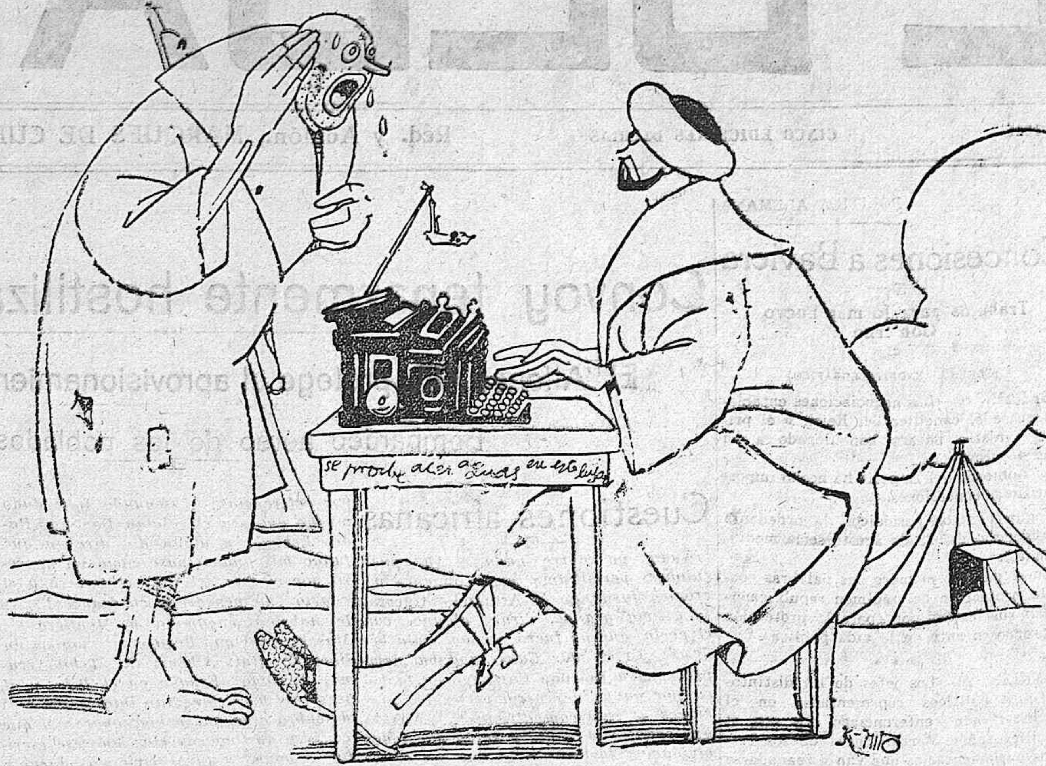
—Señor, hemos tenido que venir corriendo desde Nador hasta aquí. —¡Recontra! ¡Vaya una corridita patriótica!