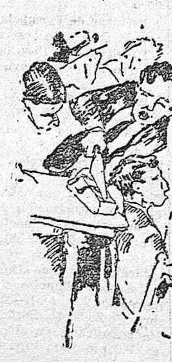
...organizaron el solemne corte de la coleta...