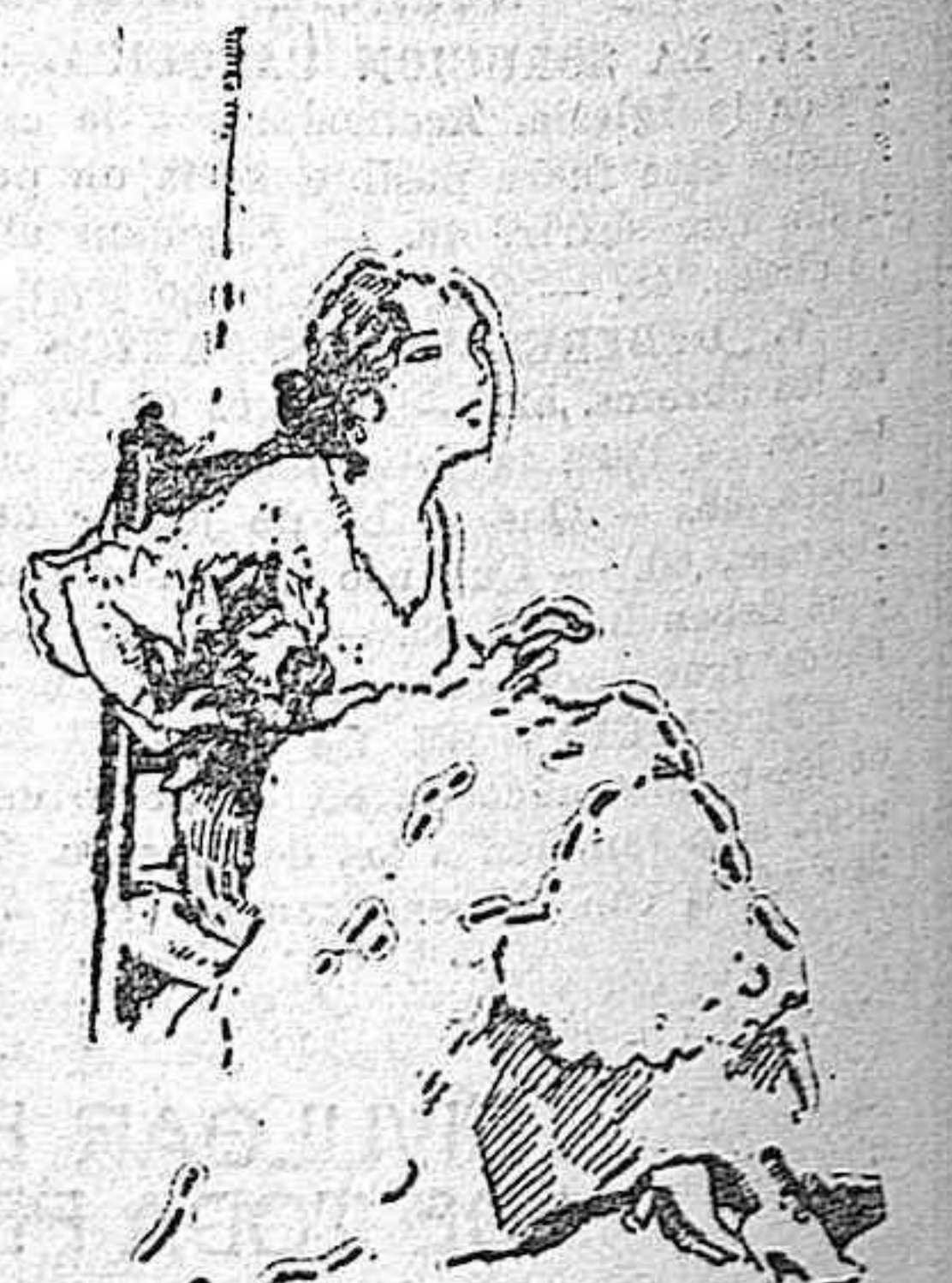
...una belleza serena y melancólica...

lla que le regaló el inclusero. La luz la iluminaba plenamente. Estaba guapa. Quizás más guapa que antes. A los solfichos cuidados de la amistad había recobrado la belleza que marchitaba la pena y la escasez. Era otra belleza, hija de la maternidad y el dolor: una belleza serena y melancólica, contrastante con la alegría de la chiquilla pizpireta y graciosa de su