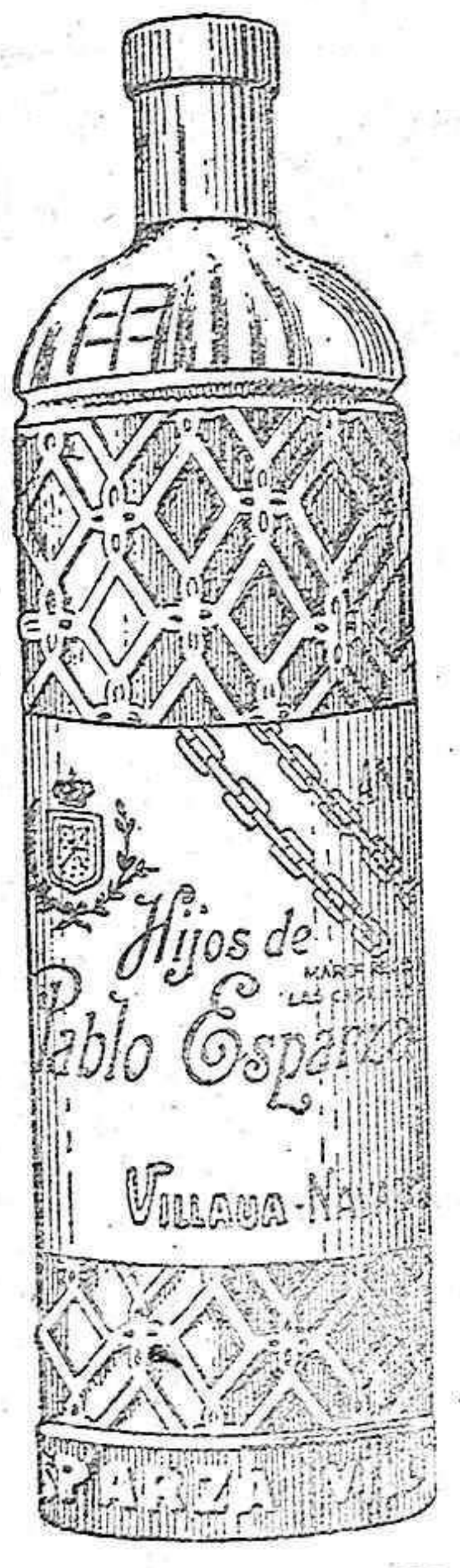
ANISADOS EXQUISITOS Las Cadenas de Navarra HIJOS DE PABLO ESPARZA

Casa Ibarra Grandes almohadones de confección para caballeros y niños.