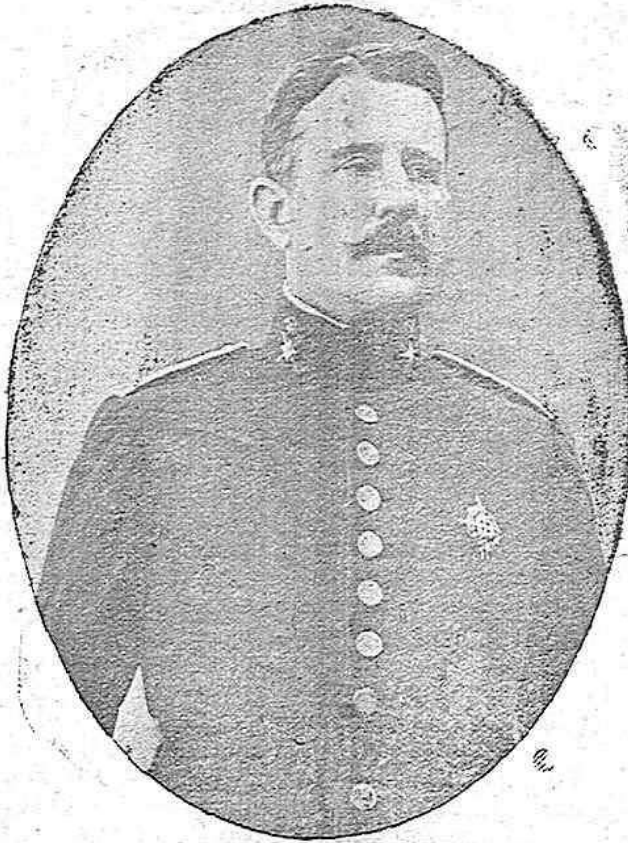
EXCMO. SEÑOR MARQUÉS DE CAVALCANTI Nombrado recientemente comandante general de Melilla

Porque ahora no se trataba de aterrizar, sino de volar, saliendo de Málaga, de Cádiz, de donde fuera.