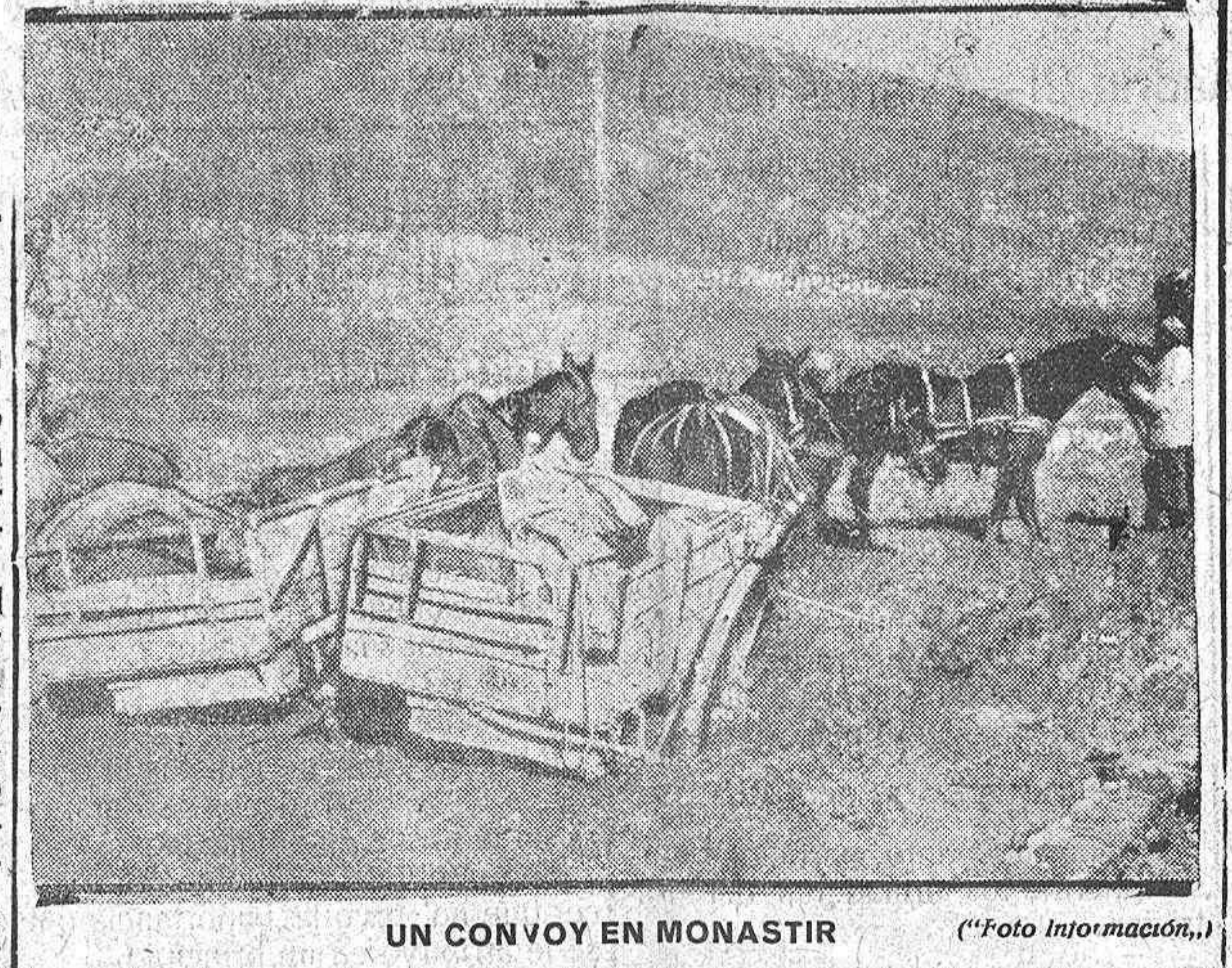
UN CONVOY EN MONASTIR