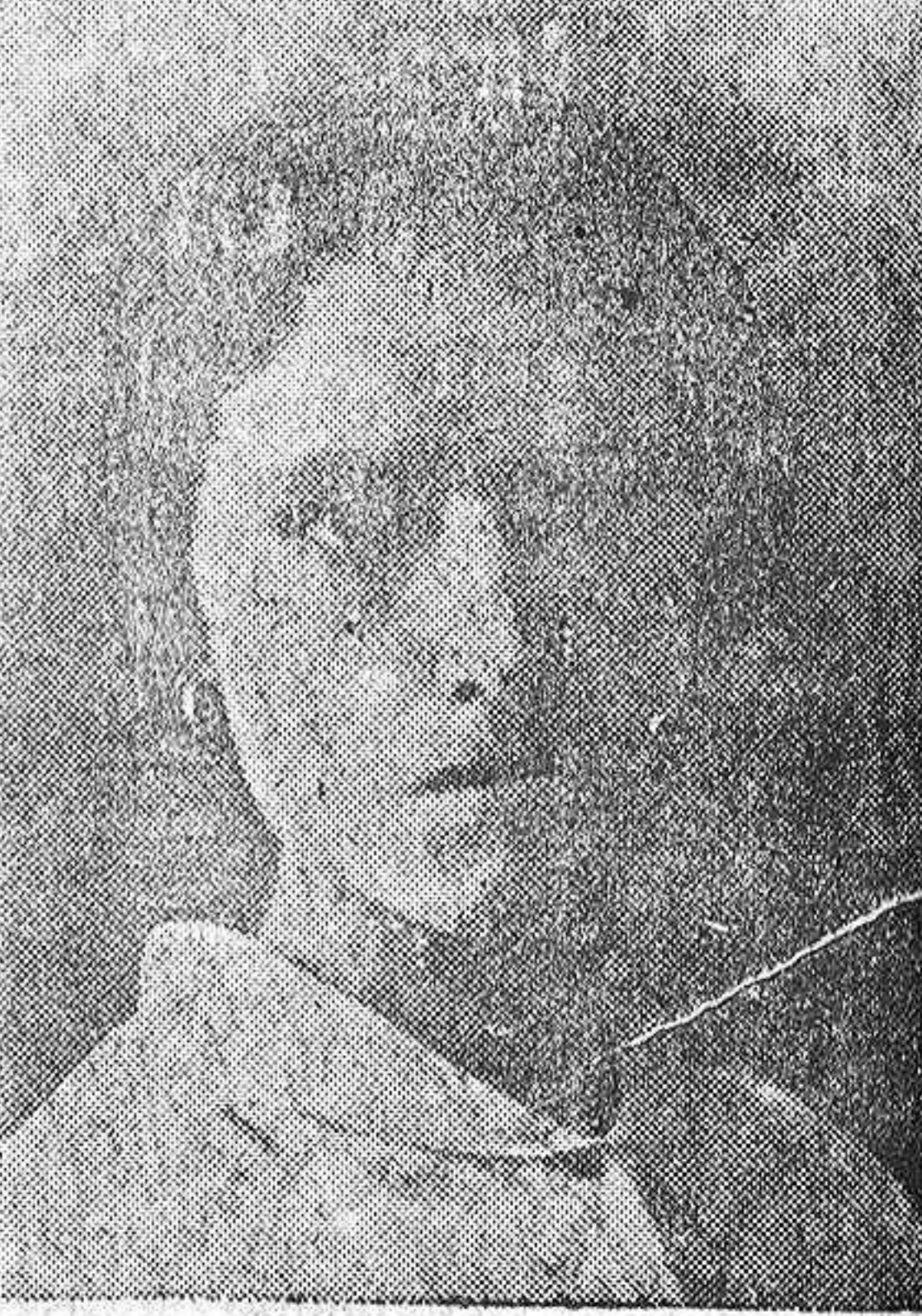
STA. MARIA CANTON

El alimento desde luego indispensable para el anémico, el pan del anémico, será un medicamento que, como las Píldoras Pink, tenga el poder de dar sangre á qui-n carece de ella. Cuando el enfermo tenga sangre, lo demás se hará por sí sólo. Bien sabéis, en efecto, que de la sangre que corre por las venas saca el organismo su vitalidad toda. Al suministrar sus elementos á la sangre, la alimentación mantiene esta vitalidad, intransmisible, por consiguiente, si no hay sangre. Todos los enfermos que han tomado las Píldoras Pink han experimentado esto que decimos. Al cabo de unos cuantos días, sin haber tenido que hacer otra cosa sino tomar dos ó tres píldoras por día, experimentan una sensación de calor y de bienestar muy grata, al mismo tiempo que se les abre el apetito. Desde ese momento empieza á mejorar grandemente el estado del anémico.