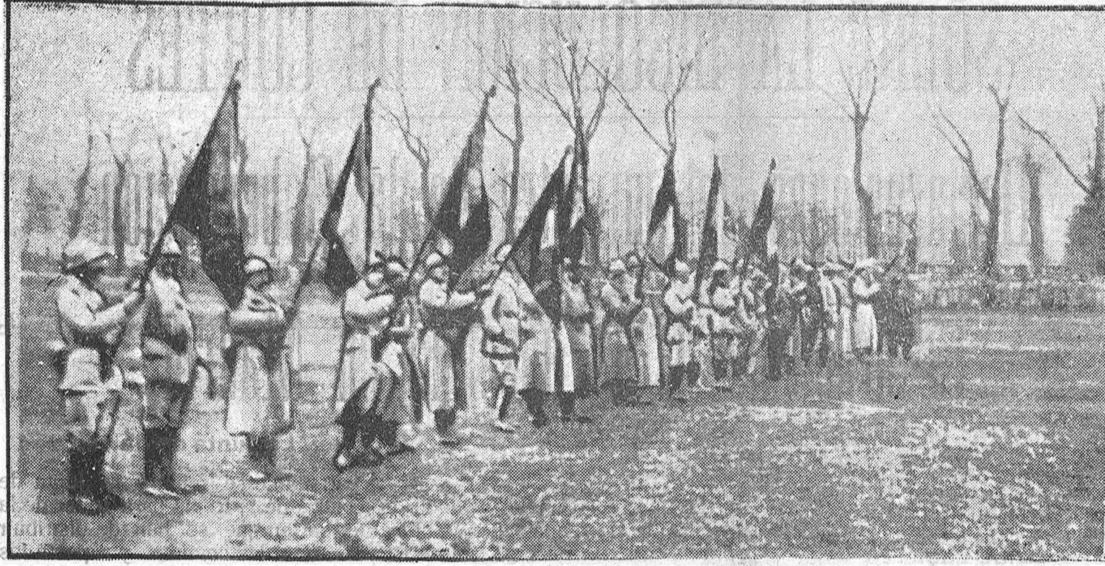
DESPUES DE LA VICTORIA DEL AISNE. -- BANDERAS CONDECORADAS