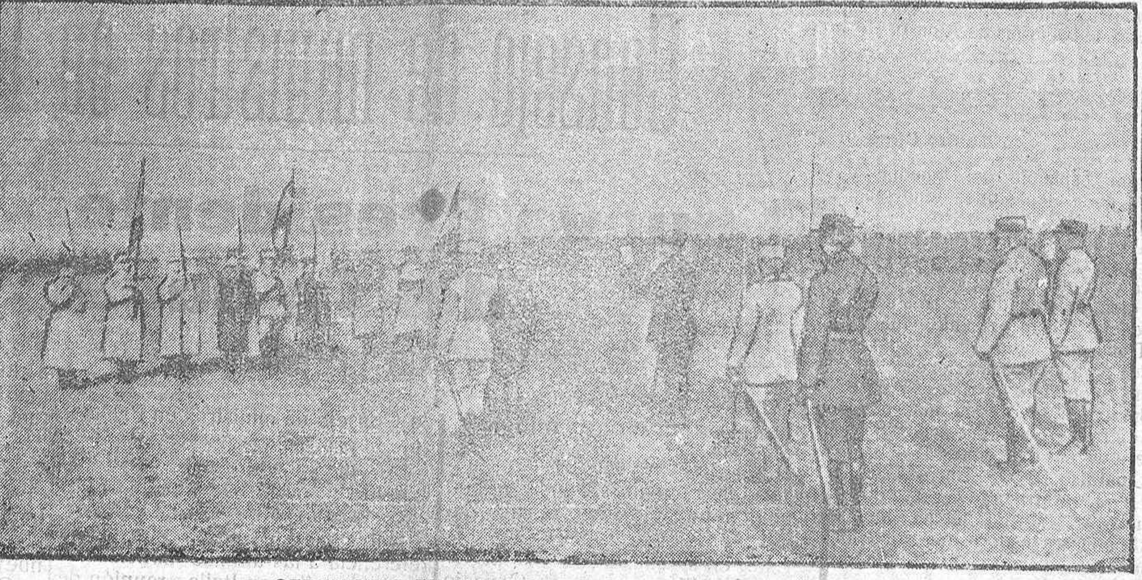
CEREMONIA EN HONOR DEL AVIADOR GUYNEMER