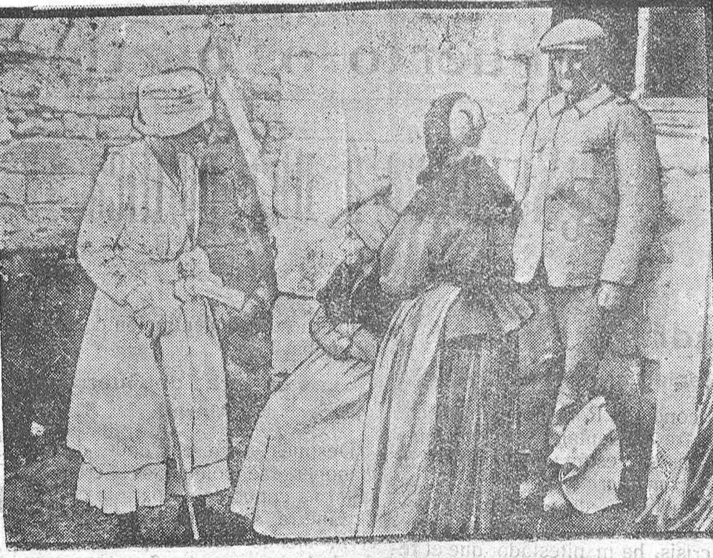
Dama del Comité americano visitando un pueblo reconquistado á los alemanes.